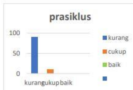
Grafik 1.1 Kecepatan Kosakata Bahasa Sunda Anak

Berdasarkan hasil data prasiklus menunjukkan pencapaian Kecepatan Menambah Kosakata Bahasa Sunda Anak Pada siswa kelas 1 di SDIT Insan Mulia di gambarkan ke dalam diagram sebagai berikut :