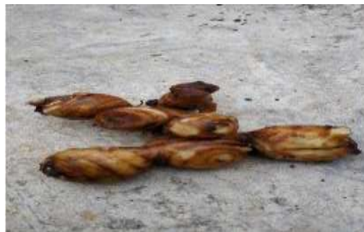
Gambar 2. Ganyong Merah