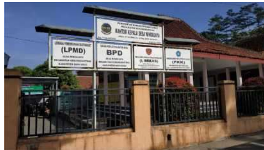
Gambar 1. Tempat pelaksanaan kegiatan pengabdian (Balaidesa Desa Windujaya)

informasi mengenai ketersediaan alat yang dapat digunakan untuk mempermudah pencapaian target kegiatan yang belum tersedia di tengah masyarakat. Persiapan selanjutnya adalah pengolahan bahan mentah sampai menjadi tepung untuk dijadikan contoh dalam demonstrasi yang akan dilakukan selama kegiatan. Tahapan persiapan berikutnya adalah menyediakan alat-alat yang dibutuhkan dalam mempermudah pencapaian target kegiatan.