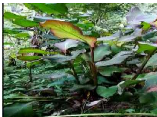
Gambar 3. Tanaman Umbi Ganyong Merah