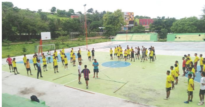
Gambar 1. Kegiatan Pembelajaran Bola Voli

Sesuai dengan hal tersebut, maka tim penyusun kegiatan pengabdian dengan media untaian tali dengan panjang 10 meter dan 3 buah tiang setinggi 3,5 meter dengan tujuan agar dapat merangsang mahasiswa untuk dapat melakukan passing bawah dan atas dengan baik melalui tes keterampilan bola voli.