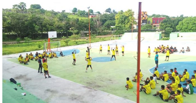
Gambar 5. Pelaksanaan Tes Keterampilan Passing Atas Bola Voli

Berdasarkan hasil pada item tes keterampilan passing atas bola voli maka dapat disimpulkan bahwa 51,9% (41 orang Mahasiswa) pada kategori Baik , 43,0% (34 orang Mahasiswa) pada kategori Cukup , 5,1% (4 orang Mahasiswa) pada kategori Kurang dan 0% (0 orang Mahasiswa) pada kategori Buruk .