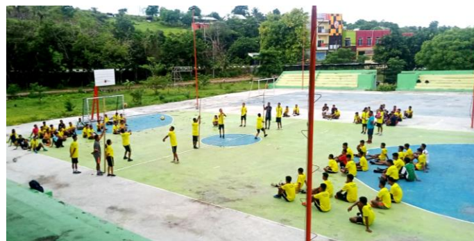
Gambar 4. Pelaksanaan Tes Keterampilan Passing Bawah Bola Voli

Berdasarkan hasil pada item tes keterampilan passing bawah bola voli selama 30 detik maka diperoleh 30,4% (24 orang Mahasiswa) pada kategori Baik , 35,4% (28 orang Mahasiswa) pada kategori Cukup , 32,9% (26 orang Mahasiswa) pada kategori Kurang dan 1,3% (1 orang Mahasiswa) pada kategori Buruk .