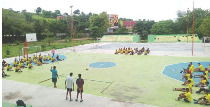
Gambar 2. Kegiatan Persiapan dan Sosialisasi

tiang dengan panjang 3,5 meter dan tali sepanjang 10 meter. Kegiatan berlanjut pada pemanasan dengan tujuan agar menghindari cedera yang akan dialami dan menyiapkan tubuh agar dapat melaksanakan kegiatan inti.