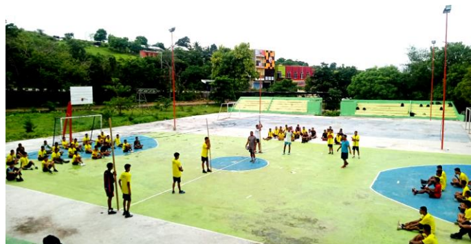
Gambar 3. Penjelasan Tahapan Pelaksanaan Tes Keterampilan Bola Voli

Mahasiswa dibagi dalam 3 kelompok dan diberikan penjelasan pembuatan media modifikasi dan pelaksanaan tes keterampilan passing bola voli. Dosen menunjuk 3 orang sebagai pencatat hasil passing bola voli dan sekaligus bertugas memanggil mahasiswa yang akan melaksanakan tes tersebut. Jumlah siswa yang akan melaksanakan tes keterampilan tersebut berjumlah 4 orang dan 4 orang mahasiswa sebagai pengamat dan penghitung skor. Bola yang dipassingkan haruslah melewati tali yang telah dipasangkan pada 3 buah tiang dalam waktu 30 detik.