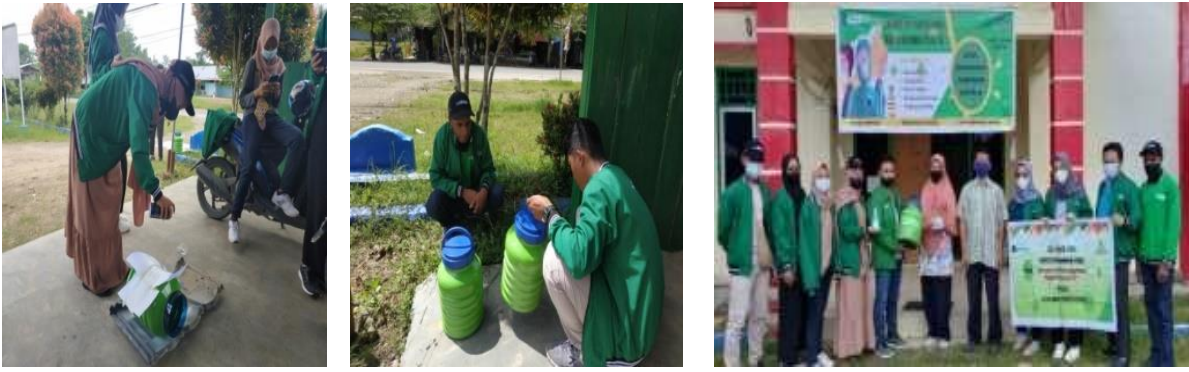
Gambar 3 Pendistribusian Alat Cuci Tangan di Kantor Kelurahan

Pada gambar 3 di atas adalah kegiatan untuk menyediakan sarana cuci tangan. Pada kegiatan ini, yang dilakukan adalah pemilihan bahan kemudian pendistribusian. Tujuan kegiatan diatas untuk menyediakan sarana cuci tangan dalam menjaga kebersihan tangan baik sebelum dan sesudah memasuki sarana umum seperti rumah makan dan perkantoran yang berada di wilayah Kelurahan Klamalu Distrik Mariat Kabupaten Sorong. Secara sederhana, sarana ini sebetulnya sebagai pembiasaan masyarakat dalam rangka penerapan pola PHBS yakni untuk mencuci tangan dengan sabun dan air yang mengalir [7].