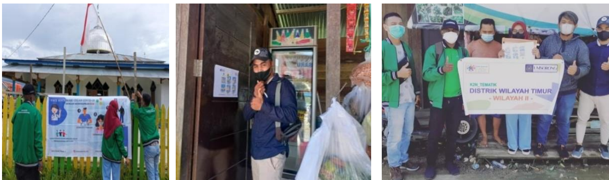
Gambar 4 Pemasangan Spanduk Himbauan 3M

Pada gambar 3 di atas adalah kegiatan untuk menyediakan sarana cuci tangan. Pada kegiatan ini, yang dilakukan adalah pemilihan bahan kemudian pendistribusian. Tujuan kegiatan diatas untuk menyediakan sarana cuci tangan dalam menjaga kebersihan tangan baik sebelum dan sesudah memasuki sarana umum seperti rumah makan dan perkantoran yang berada di wilayah Kelurahan Klamalu Distrik Mariat Kabupaten Sorong. Secara sederhana, sarana ini sebetulnya sebagai pembiasaan masyarakat dalam rangka penerapan pola PHBS yakni untuk mencuci tangan dengan sabun dan air yang mengalir [7].