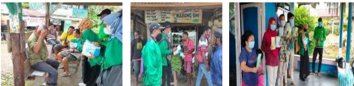
Gambar 2 Pembagian Masker Gratis di lingkungan sekitar

Pada gambar 1 di atas adalah kegiatan Penyemprotan Desinfektan pada tempat ibadah seperti Masjid dan Gereja serta lingkungan masyarakat. Hal tersebut bertujuan agar warga setempat dapat mengetahui cara mencegah penularan Covid-19. Disamping itu, pelaksanaan Pengabdian Kepada Masyarakat ini melibatkan mahasiswa Kuliah Kerja Nyata dalam melakukan penyemprotan di tempat-tempat ibadah dan lingkungan masyarakat menggunakan cairan desinfektan. Adapun manfaatnya agar mempermudah warga melakukan aktivitas seperti biasa namun tetap terlindungi dari kuman dan virus.