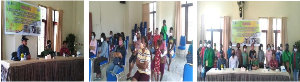
Gambar 5 Sosialisasi

Diri dan Keluarga yang bertempat di Kelurahan Klamalu Distrik Mariat Kabupaten Sorong.