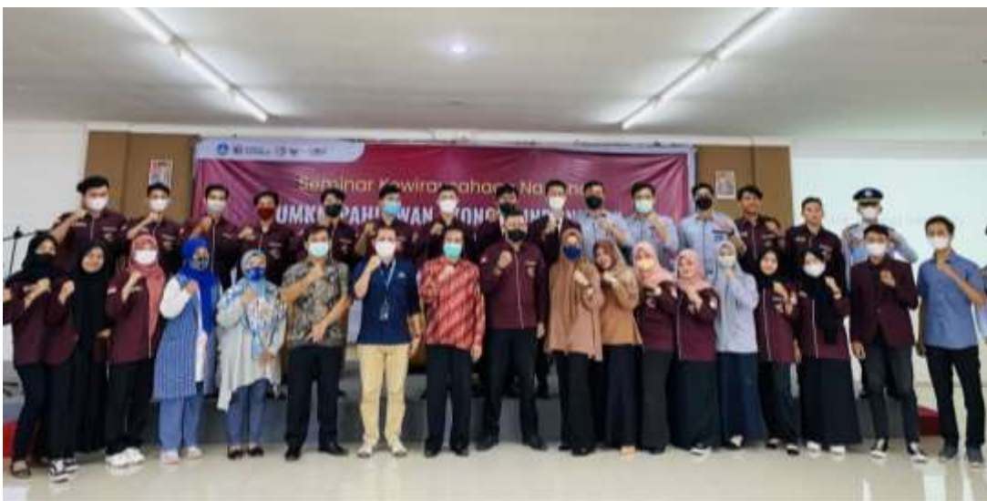
Gambar 3.1 Foto bersama pada kegiatan Open Ceremony Seminar Kewirausahaan Nasional