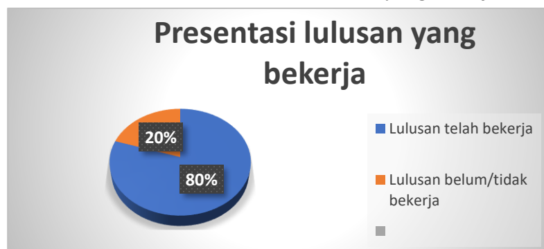
Gambar 1. Presentasi lulusan yang bekerja

Jika digambarkan ke dalam Pie Chart , maka kondisi tersebut akan nampak sebagai berikut: