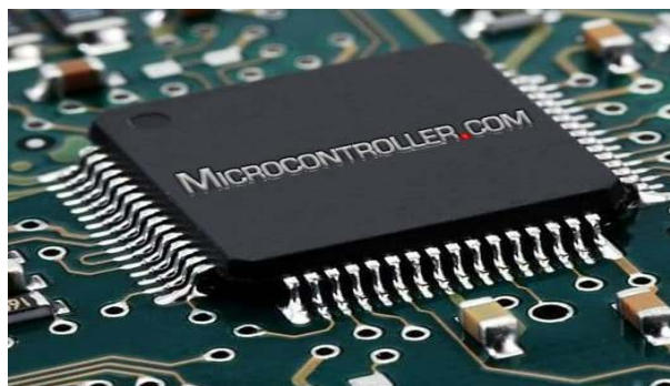
Gambar 1. Mikrokontroler