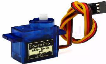
Gambar 3. Motor Servo

Spesifikasi Motor servo continuous sebagai berikut :