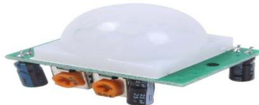
Gambar 2. Sensor PIR