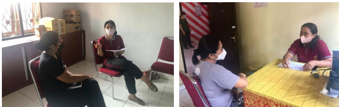
Gambar 4. Sesi wawancara sebelum kegiatan pelatihan

Tahapan pertama sebelum kegiatan pelatihan ini dimulai, para instruktur yang terdiri dari 10 orang dosen dari Program Studi Sastra Inggris Fakultas Bahasa Asing (FBA) Universitas Mahasaraswati Denpasar melakukan wawancara kepada 26 orang peserta pelatihan. Wawancara dilakukan berdasarkan prinsip umum mengajar menurut Hamzah (2006) bahwa para pengajar dalam menjalankan peran dan fungsinya harus berdasarkan pengalaman yang telah dimiliki peserta didik. Oleh karena itu, tingkat kemampuan peserta didik sebelum proses belajar mengajar berlangsung harus diketahui. Para peserta pelatihan diberikan beberapa pertanyaan sederhana dalam bahasa Inggris dan mereka diminta untuk memperkenalkan diri mereka secara singkat menggunakan bahasa Inggris. Hal ini dilakukan agar para instruktur pelatihan dapat menyesuaikan metode pembelajaran dan materi yang diberikan di kegiatan pelatihan ini.