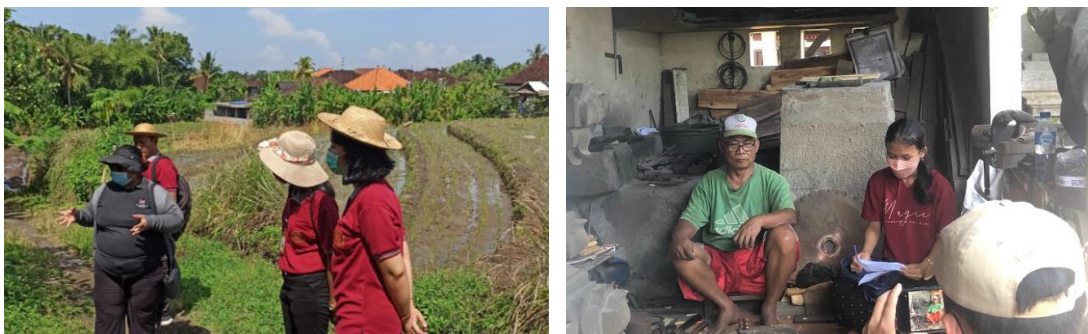
Gambar 7. Peserta pelatihan melaksanakan praktek langsung di objek wisata Desa Tista