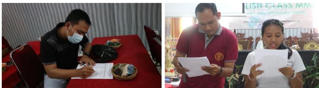
Gambar 6. Peserta pelatihan mengerjakan soal latihan dan mempraktekkan beberapa language expressions dan kosa kata berbahasa Inggris didampingi oleh instruktur

Latihan dan praktek dilakukan setelah peserta pelatihan diberikan informasi mengenai suatu pengetahuan sesuai dengan rancangan pembejaran yang telah disusun sebelumnya oleh para instruktur. Latihan yang diberikan berupaka latihan tertulis ( worksheet ) berupa quiz yang secara langsung dikerjakan oleh peserta pelatihan dan didampingi oleh para instruktur dan mahasiswa. Selain itu, para peserta pelatihan juga mempraktekkan beberapa language expressions . Para instruktur secara langsung memberikan umpan balik ( feedback ) terhadap hasil latihan dan praktek setiap peserta pelatihan.