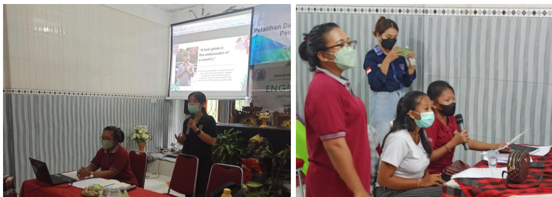
Gambar 5. Pemberian materi dan teori dengan metode ceramah

latihan. Ceramah dilakukan selama 45 menit dan disela-sela presentasi juga diadakan sesi tanya jawab dan diskusi. Pemberian materi menggunakan bahasa Inggris dan bahasa Indonesia karena sebagian dari peserta pelatihan belum memiliki keterampilan yang baik dalam memahami kalimat dalam bahasa Inggris secara utuh. Hal inilah yang menjadi acuan utama para instruktur, yakni meningkatkan keterampilan berbahasa Inggris para peserta latihan.