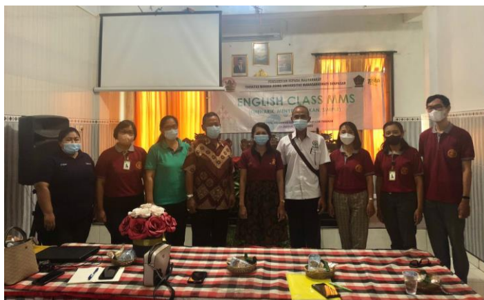
Gambar 3. Penandatanganan Memorandum of Agreement (MoA)

Mahasaraswati Denpasar mengadakan kerja sama guna meningkatkan keterampilan berbahasa Inggris para calon pramuwisata lokal mereka. Kegiatan pengabdian ini diawali dengan penandatanganan Memorandum of Agreement (MoA) atau Perjanjian Kerja Sama antara Fakultas Bahasa Asing (FBA) Universitas Mahasaraswati Denpasar dengan Desa Tista.