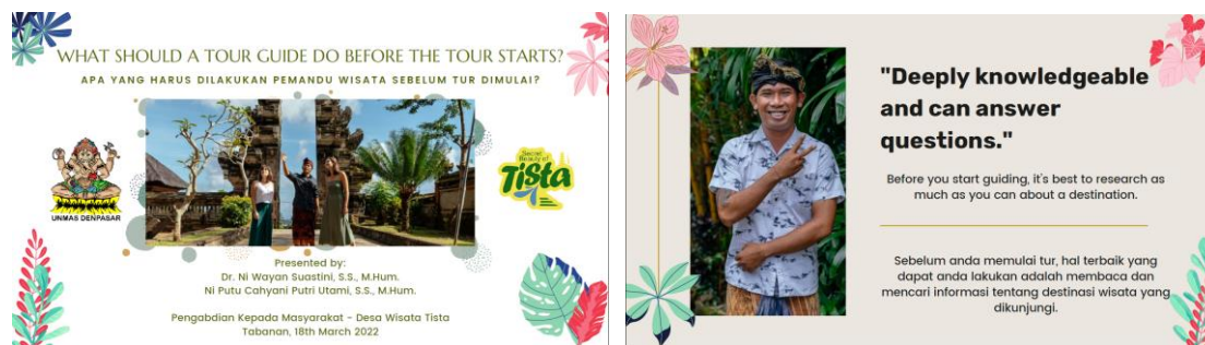
Gambar 1. Materi kelas teori mengenai peran dan fungsi pramuwisata