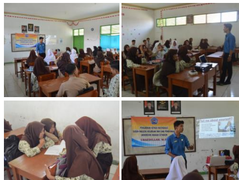
Gambar 1. Pelatihan Wawancara Kerja dalam Bahasa Inggris

menggunakan slide dan video tutorial. Kemudian peran mitra adalah mengaplikasikan apa yang ada dalam video tutorial tersebut sebagai materi pembelajaran praktek wawancara kerja dalam bahasa Inggris.