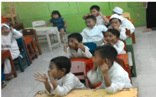
Gambar 1. Kegiatan Saat Di Kelas

Kegiatan kelas yang mengembangkan kemampuan peserta didik untuk mengekspresikan diri melalui berbicara akan terlihat komponen penting dari kursus bahasa itu. Namun, sulit untuk merancang dan mengelola kegiatan tersebut dari pada kegiatan mendengarkan, membaca dan menulis. Ingat dan bayangkan kembali keberhasilan dalam berbicara di dalam kelas seperti seorang guru atau berpartisipasi layaknya sebagai seorang mahasiswa. Apa karakteristik dari dari aktivitas yang membuat sukses dalam berbicara.