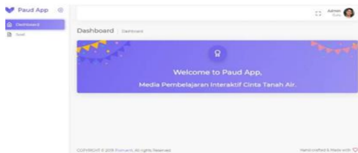
Gambar 1. Halaman awal

Hasil test menunjukkan manfaat yang signifikan untuk murid paud karena adanya visual gambar akan memudahkan para murid Paud lebih paham dan mudah mengingat akan materi yang disampaikan oleh para guru. Berikut ini kami sampaikan tampilan media pembelajaran yang dipergunakan dalam pembelajaran sebagai berikut