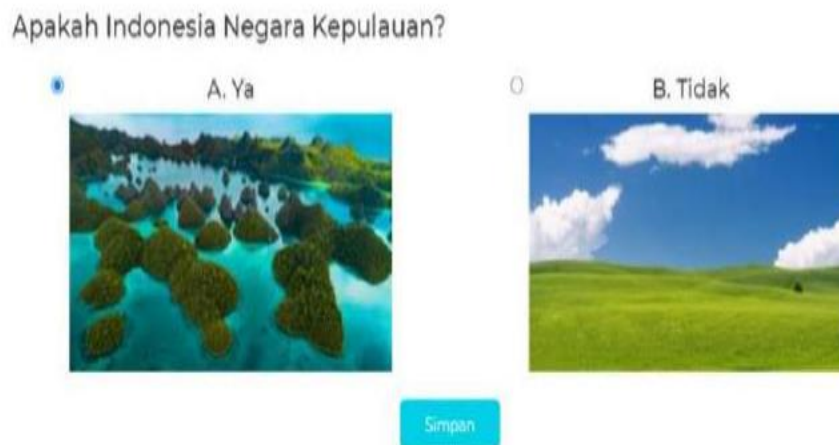
Gambar 2. Salah satu pertanyaan