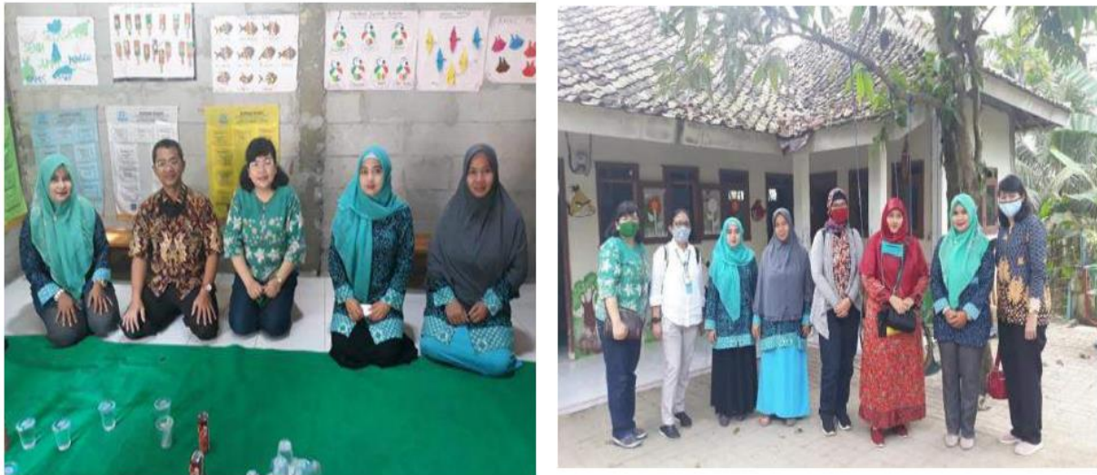
Gambar6. Foto kegiatan Bersama guru dan Tim Abdimas