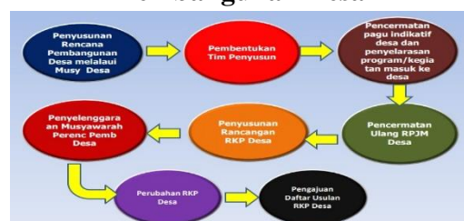
Gambar 1.1 Alur Proses Penyelenggaraan Musyawarah Pembangunan Desa

Pada era desentralisasi kebijakan saat ini, masyarakat pedesaan sudah saatnya diberikan peluang kesempatan dan wewenang lebih untuk dapat terlibat mengelola pembangunan daerahnya. Kewenangan yang diberikan kepada masyarakat dimulai sedini mungkin pada tahap perencanaan atau perumusan program, tahap peaksanaan, hingga sampai tahap evaluasi sekalipun. Metode pendekatan tersebut memberikan kemungkinan bahwa semua kegiatan pembangunan desa akan memenuhi kebutuhan masyarakat desa dan sesuai dengan kondisi daerah setempat (kondisi sosial, budaya, ekonomi dan lingkungan). Untuk menunjak metode tersebut, tahap sosialisasi musrenbangdes diperlukan oleh pemerintah desa agar masyarakat bisa memaksimalkan peran mereka dalam proses perencanaan pembangunan di desa. Berikut adalah gambar alur proses penyelenggaraan musrenbangdes, sebagai berikut: