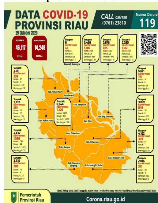
Sumber Data : Tim Gugus Tugas Covid-19 Propinsi Riau (covid19.riau.go.id, 2020)

Berdasarkan gambar. 1 dapat dilihat bahwa di kota Pekanbaru terdapat 6.944 Orang dengan kategori suspek Covid-19, sebanyak 7.100 orang terkonfirmasi positif covid-19, terdapat 1.400 orang isolasi, pasien dalam perawatan 307 orang dan sebanyak 168 orang diantaranya meninggal dunia.