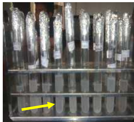
Gambar 2. Kemampuan rizobakteri memfiksasi N ditunjukkan oleh adanya perubahan kekeruhan suspensi rizobakteri (semakin keruh, fiksasi N semakin kuat)

2, PKNW 1, PKNW 2, PKNW 3, PKNW 4, PKNW 5, PKNW 6, PKNW 7, PKNW 8, PKLK 1, PKLK 2, PKLK 3, PKLK 4, PKLK 6, PKLK 7 dan PKLK 8. Kemampuan setiap isolat untuk memfiksasi nitrogen berbeda-beda, hal ini dapat dilihat dari tingkat kekeruhan yang terjadi pada setiap tabung reaksi yang berisi isolat padi sehat. Performansi kemampuan fiksasi N oleh rizobakteri ditampilkan pada Gambar 2.