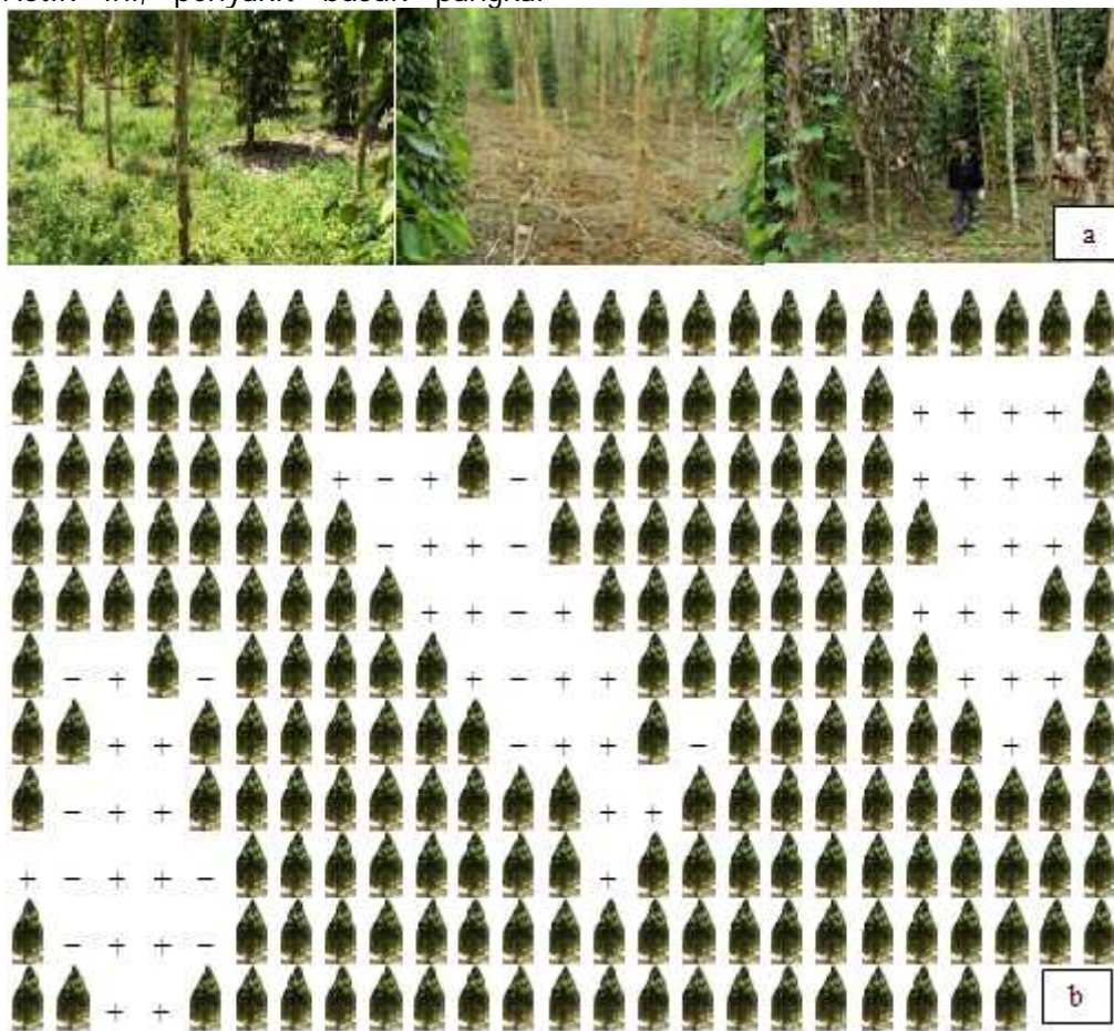
Gambar 2. Pola agihan mengelompok penyakit busuk pangkal batang lada: a. kondisi di lapangan, b. ilustrasi skema agihan. 🌳 : tanaman sehat, + : tanaman sakit

batang lada pada semua lokasi penelitian mempunyai agihan mengelompok. Penyakit tersebut terus berkembang dan pada akhirnya penyakit tersebut memenuhi seluruh kebun lada. Keadaan ini mempertegas bahwa penyebab penyakit busuk pangkal batang lada adalah patogen terbawa tanah dan bukan disebarkan oleh angin. Menurut Brown (1997), patogen terbawa tanah mempunyai agihan penyakit yang mengelompok, sedangkan patogen terbawa udara mempunyai agihan acak. Pengelompokan ini terjadi karena penyebaran inokulum P. capsici dalam tanah dimediasi oleh air dan kekuatan kapiler akar (Granke et al. , 2009) sehingga inokulum patogen terdistribusi secara terbatas sekitar tanaman sakit.