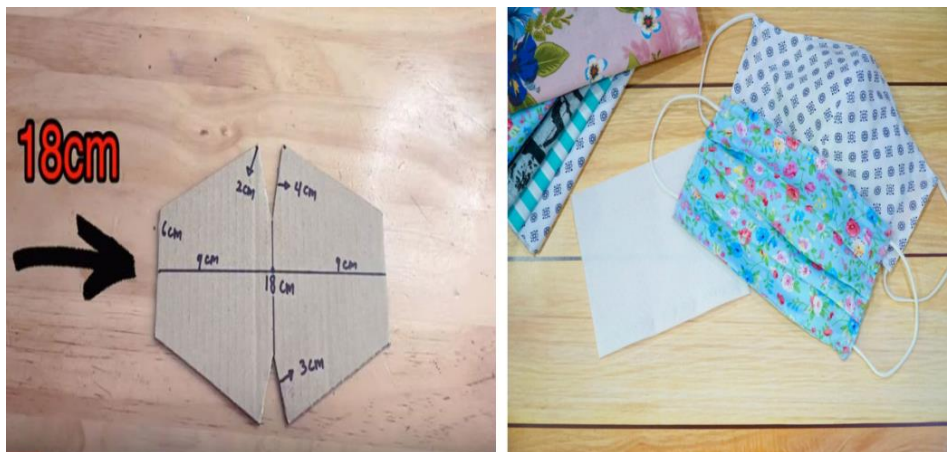
Gambar 1.2 Hasil Olahan Kegiatan Ekonomi Kreatif