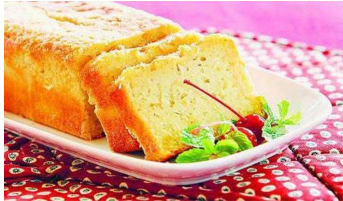
Gambar 1.1 Hasil Olahan Produksi Olahan Kue Dari Hasil Pertanian (Perkebunan)

perekonomian yang berdaya saing dan memiliki cadangan sumber daya yang terbarukan, (2017:01).