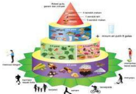
Gambar tumpeng gizi seimbang