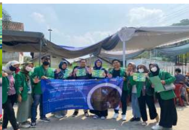
Penyuluhan menggunakan alat bantu gambar, team PKM, dosen pembimbing dan pembina lahan