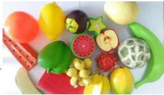
Gambar replika buah - buahan