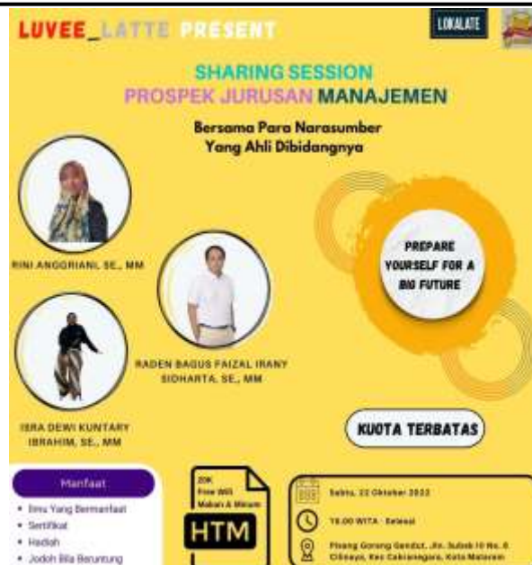
Gambar 2. Poster kegiatan sharing session prospek jurusan manajemen