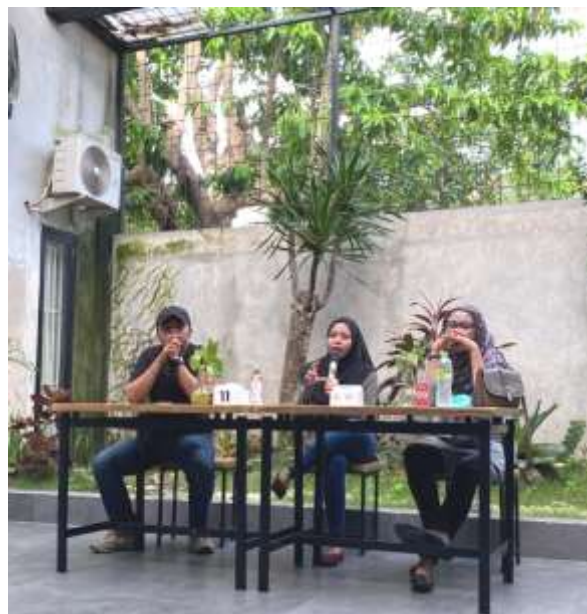
Gambar 3. Sharing session oleh narasumber dosen

Pada hari Sabtu, 22 Oktober 2022 kegiatan dilaksanakan sesuai dengan rencana berlokasi pada Pisang Goreng Gendut Cakranegara. Panitia open gate sekitar pukul 13.00 untuk menerima kedatangan peserta dan narasumber di lokasi kegiatan dengan mengisi daftar hadir sebelum memasuki area kegiatan. Kegiatan sharing session diadakan tepat pukul 15.00 karena peserta juga sudah memenuhi area kegiatan. Berikut beberapa dokumentasi saat pelaksanaan acara :