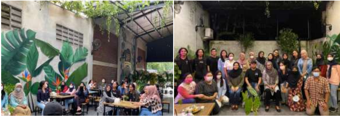
Gambar 5. Foto peserta kegiatan saat pelaksanaan dan setelah kegiatan

Berikut adalah gambaran situasi peserta saat pelaksanaan sharing session baik sedang mendengarkan penjelasan dari narasumber maupun sesi diskusi dan tanya jawab serta foto bersama setelah kegiatan berlangsung.