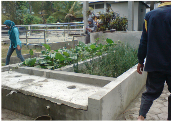
Gambar 1. Taman tanaman air dengan tanaman bambu air