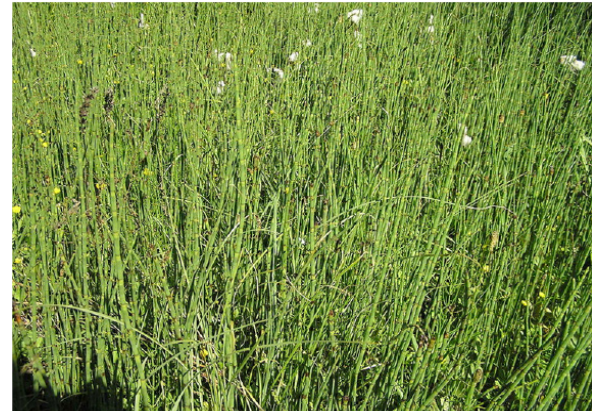
Gambar 2: Bambu air ( Equisetum heyemale )

reaksi digunakan persamaan dari USEPA (1998) dengan asumsi reaksi kinetik terjadi adalah reaksi order satu maka :