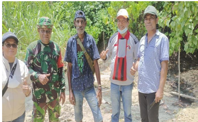
Gambar 5. Tim PKM , Aparat Kampung, Babinsa dan Aparat Perbatasan di Lokasi Sungai Air Panas Desa tapal batas Kampung Mosso

Dari tim PKM yang berangkat ke lokasi sumber air panas terdiri dari dua kendaraan, namun karena medan lokasi sumber air panas yang berat sehingga hanya terdapat satu tim yang sampai ke lokasi sumber air panas sebagai salah satu kajian pelaksanaan PKM dengan Tema potensi wisata desa tapal batas Distrik Muara Tami Kota Jayapura: Pengembangan dan Promosi.