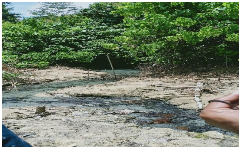
Gambar 6. Sumber air panas Kampung Mosso

Dari tim PKM yang berangkat ke lokasi sumber air panas terdiri dari dua kendaraan, namun karena medan lokasi sumber air panas yang berat sehingga hanya terdapat satu tim yang sampai ke lokasi sumber air panas sebagai salah satu kajian pelaksanaan PKM dengan Tema potensi wisata desa tapal batas Distrik Muara Tami Kota Jayapura: Pengembangan dan Promosi.