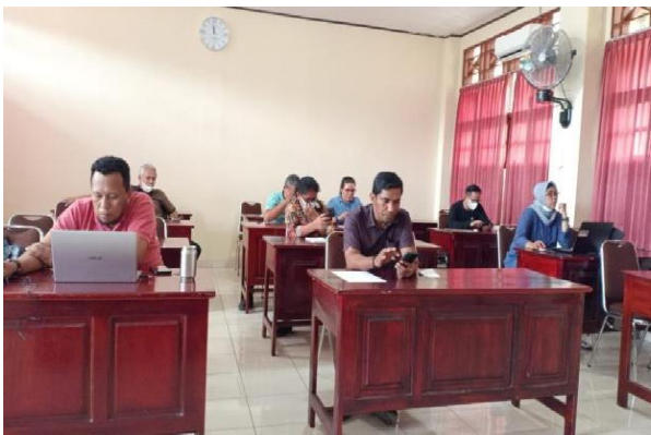
Gambar 1. Pertemuan TIM PKM

Pelaksanaan PKM ini di harapkan dapat meningkatkan ekonomi masyarakat desa khususnya Desa Tapal Batas Distrik Muara Tami Kota Jayapura. PKM ini sudah dilaksanakan sejak tanggal 22 february 2022, dimana Tim melakukan pertemuan untuk membahas program kegiatan yang akan dilaksanakan dan menetapkan lokasi PKM. Hasil Pertemuan tim selanjutnya melakukan pertemuan tim dengan pemerintah Kota Jayapura yang di wakili oleh Kepala Badan Perbatasan Kota Jayapura pada tanggal 24 Februari 2022 mulai dari Jam 8.00-9.00 WIT diruang rapat Setda Kota Jayapura. Dalam pertemuan tersebut Tim PKM STIE Port Numbay menyampaikan tujuan dilakukannya PKM dengan menyampaikan 4 Sasaran kegiatan yakni: 1) Pertanian dan Perikanan, 2) Pariwisata, 3). Bumdes 4). Ekonomi Masyarakat.