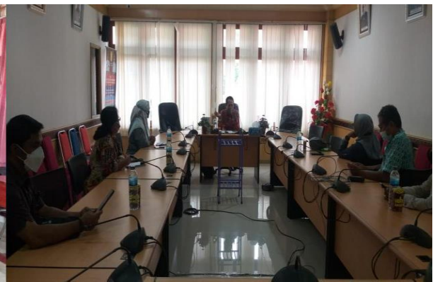
Gambar 2. Pertemuan Tim Dengan Pemerintah Kota Jayapura yang di wakili oleh Kepala Dinas Perbatasan Kota Jayapura