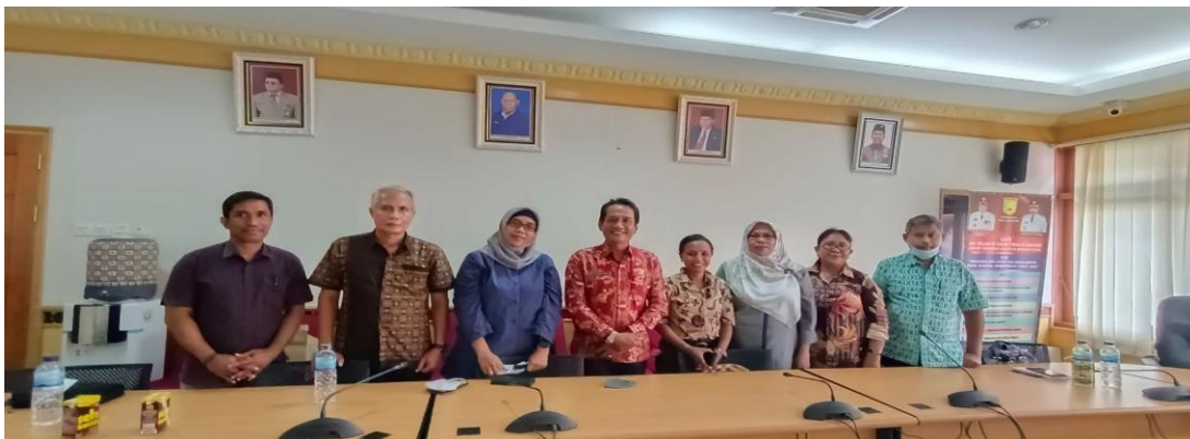
Gambar 3. Tim PKM bersama Kepala Dinas Perbatasan Kota Jayapura

Dari pertemuan tersebut maka, Pemerintah Kota Jayapura tersebut menyampaikan bahwa Tim di minta untuk menyusun TOR kegiatan PKM dan diserahkan pada pemerintah Kota Jayapura. Selanjutnya di tetapkan waktu pelaksanaan survei lokasi PKM di Desa Tapal Batas Kampung Mosso Distrik Muara Tami yang dilaksanakan pada tanggal 25 Maret 2022.