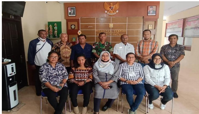
Gambar 7. Bersama Aparat Distrik Muara Tami, Dan Danramil Muara Tami