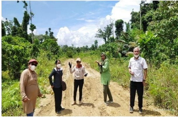
Gambar 4. Tim menuju Lokasi Desa Tapal Batas Kampung Mosso