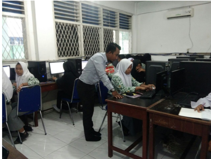
Gambar 3. Pelatihan Pembuatan Aplikasi Penjualan Barang

Form digunakan untuk merepresentasikan ke user atau menerima inputan dari user data-data dalam tabel/query dalam bentuk interface grid, tombol, dan lain-lain kontrol windows. form dalam access bisa dimasukkan ke dalam form lain sebagai control sub form, biasanya jika bekerja dalam transaksi master-detail. Pada pelatihan pembuatan laporan keuangan ini diikuti oleh 24 peserta yang terdiri dari siswa/I SMK UISU.