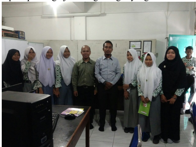
Gambar 4. Foto Bersama Para Peserta