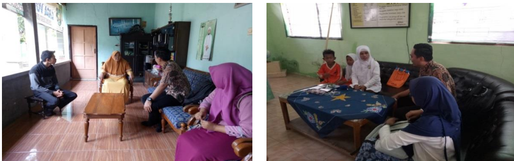
Gambar 1. Tahap observasi awal kepada pihak sekolah

Dalam tahap persiapan dilakukan observasi ke sekolah mitra. Observasi dilakukan dengan mewawancarai sejumlah guru terkait kebiasaan pergaulan anak-anak di sekolah sehari-hari. Hasil wawancara menunjukkan bahwa mencaci fisik sudah menjadi hal yang biasa terjadi di sekolah. Karena terlampau sering dilakukan, penanganan yang diberikan terhadap korban cacian pun terkesan tidak menjadi prioritas. Selama tidak terjadi perkelahian fisik yang mengakibatkan luka serius, guru jarang memberikan pelayanan khusus pada anak-anak yang sering mencaci maupun anak-anak yang sering menjadi korban perilaku tersebut. Wawancara juga dilakukan kepada siswa. Siswa yang akan menjadi duta antibullying diminta menjawab pertanyaan seputar bullying. Pada umumnya, siswa tidak akrab dengan istilah bullying, mereka hanya mengetahui bahwa mencaci temannya adalah hal biasa. Apabila korban cacian menunjukkan emosi dengan marah dan menangis histeris, beberapa siswa yang diwawancara memilih melaporkan pada guru dan yang lainnya mengatakan tidak peduli. Siswa juga ditanya tentang sikapnya terhadap korban cacian. Walaupun beberapa dari mereka menyatakan berani membela, sebagian lainnya menyatakan tidak berani membela teman yang menjadi korban cacian.