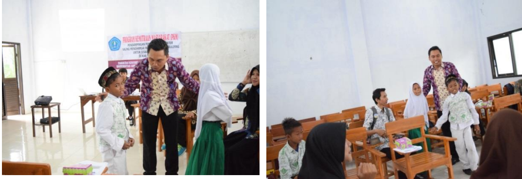
Gambar 3. Tahap Pendampingan Pelatihan kepada duta anti bullying

pengetahuannya tentang perilaku yang mengarah kepada tindakan bullying kepada teman-temannya. Dengan demikian, teman-teman di sekitar siswa duta anti bullying sudah mulai mengenal perilaku yang mengarah kepada tindakan bullying dan akibat dari perilaku tersebut.