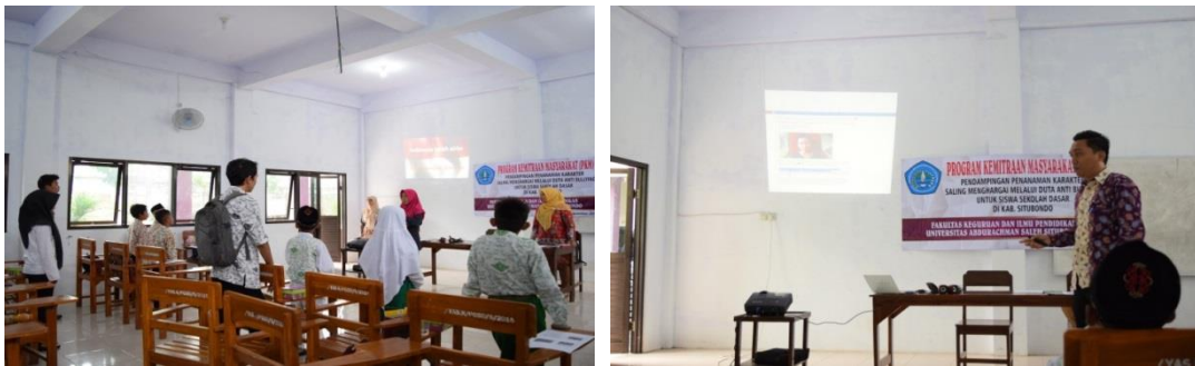
Gambar 3. Tahap Sosialisasi dan Pembentukan kader duta anti Bullying

memberikan pemahaman tentang bentuk perilaku bullying, dampaknya terhadap korban, dan bagaimana cara mencegah dan membantu korban. Dalam kegiatan ini juga dilakukan kegiatan simulasi atau bermain peran. Siswa yang ditunjuk diminta untuk menjadi pelaku dan korban bullying. Melalui kegiatan bermain peran diharapkan siswa dapat merasakan perasaan korban bullying dan mengaplikasikan cara mencegah dan membantun korban bullying. Siswa yang mengikuti kegiatan sosialisasi ini tampak antusias. Mereka mengikuti materi sampai selesai dan menunjukkan ketertarikannya saat melakukan kegiatan bermain peran. Selain siswa duta anti bullying, guru pendamping juga dilibatkan dalam sosialisasi bullying. Gurup pendamping yang dilibatkan dalam sosialisasi nantinya akan menjadi pendamping di lapangan dalam kampanye anti bullying yang dilakukan siswa duta anti bullying. Guru pendamping ini yang nantinya akan memantau bagaimana kinerja duta dan perubahan apa yang sudah dilakukan.