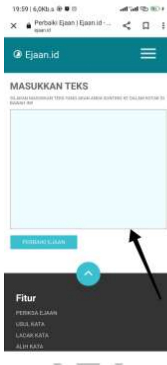
Gambar.4 Tampilan halaman input data