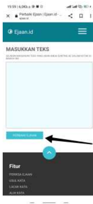
Gambar.5 tampilan halaman input data finish

6) hasilnya akan keluar, Jumlah kesalahan pada data akan bertambah seiring bertambahnya jumlah kesalahan penulisan yang dilakukan oleh pengguna bahasa Indonesia.