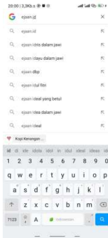
Gambar2. tampilan pencaharian google