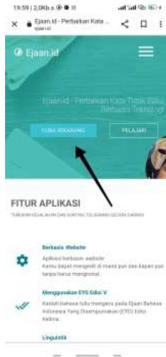
Gambar 3. Tampilan awal website ejaan.id