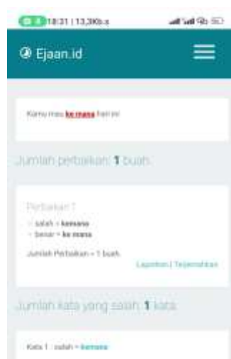
Gambar.6 tampilan halaman dari hasil input data

6) hasilnya akan keluar, Jumlah kesalahan pada data akan bertambah seiring bertambahnya jumlah kesalahan penulisan yang dilakukan oleh pengguna bahasa Indonesia.