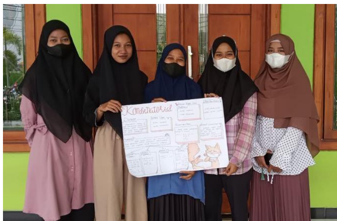
Gambar 3. Tim beserta hasil Mind Mapping yang Telah Dibuat