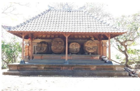
Gambar. 4. Sarkofagus Bali

muda berkembang pada masa perundagian dengan memperlihatkan bentuk kubur peti batu dan sarkofagus (Poeponegoro, Notosusanto, 1993). Itulah beberapa contoh yang peninggalan sejarah cagar budaya yang merepresentasikan kearifan lokal di bidang solidaritas. Masih banyak tradisi dan peninggalan sejarah kebudayaan di Bali yang mencerminkan karakter solidaritas masyarakatnya. Jadi peninggalan sejarah itu hanya sebagai sebuah simbolisasi untuk tetap memperkuat solidaritas pada masa sekarang dan masa yang akan datang.