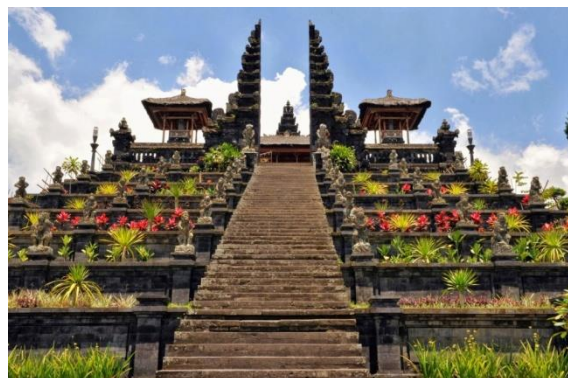
Gambar 8. Pura Besakih

clan yang ada di Bali. Jadi dari pernyataan itu pura besakih dipakai sebagai pura pemersatu clan-clan yang ada di Bali secara keseluruhan. Simbolisasi bangunan pura besakih ini membuktikan adanya kearifan politik yang dimiliki oleh kerajaan di Bali untuk mempersatukan masyarakatnya yang berbeda-beda.