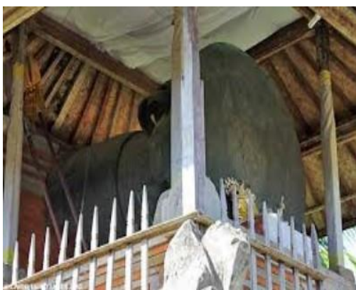
Gambar 1. Nekara Pejeng Bali

masyarakat sudah menggunakan cara berpikir mereka untuk mengolah suatu benda yang tidak berbentuk menjadi benda yang memiliki nilai budaya tinggi yang direpresentasikan dalam bentuk Nekara Pejeng. Dan akhirnya penguasaan iptek dibidang metalurgi yang berasal kearifan lokal masa prasejarah masih dipakai sampai sekarang (Laksmi, 2011).