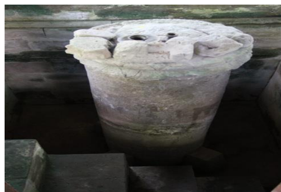
Gambar 9. Prasasti Blanjong

https://www.putrama.co.id/beberapa-hal-menarik-pura-besakih