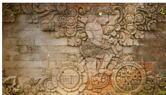
Gambar 2. Gambar Relief Orang Bersepeda

Jadi setiap individu atau kelompok mempunyai caranya masing-masing untuk merepresentasikan nilai-nilai estetika. Representasi nilai kearifan lokal dari segi estetika dapat dilihat pada Relief yang ada pada salah satu tempat suci di Bali, yaitu Pura Meduwe Karang yang ada di Buleleng, Bali. Karyaukiran relief bule (orang asing) menggunakan sepeda pada purameduwe Karang mencerminkan kebebasan berekspresi secara lokalitas sehingga menghasilkan karya estetika yang berbeda dari peninggalan lainnya. Artinya secara lokalitas masyarakat setempat mengabadikan moment kedatangan orang asing yang dibuat dalam bentuk lukisan relief. Hasil cipta, rasa dan karsa ini merupakan sebuah pengabdian moment dan salah satu implementasi nilai kearifan lokal dari estetika.