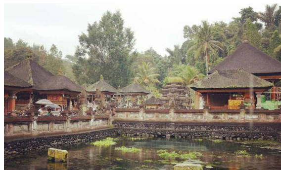
Gambar 5. Kolam Penampungan Air di Pura Tirta Empul

Alam merupakan bagian yang tak terpisahkan dari hidup manusia. Orang Bali mengusahakan nilai-nilai spiritual yang membuat mereka mampu memuliakan dirinya dan terbebas dari hal-hal yang mengganggu (Semara, 2014). Jadi secara tidak langsung kearifan lokal di bidang lingkungan ini mengantarkan pada pengamalan ideologi Tri Hita Karana, yaitu menjaga hubungan baik dengan Tuhan, manusia, dan lingkungan.