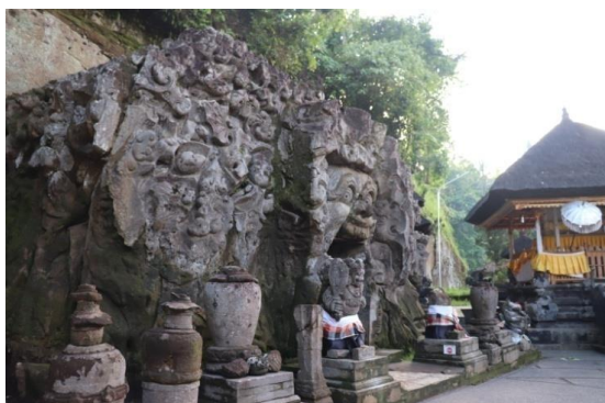
Gambar. 6 Pura Goa Gajah

Jadi dari penjelesan tersebut Sinkretisme agama ini melambangkan kearifan lokal masyarakat Bali dalam hal toleransi. Kearifan lokal ini tercermin dari banyak-banyaknya peninggalan-peninggalan sejarah di Bali. Selain Pura Goa Gajah, dan Candi Kalibukbuk ada lagi peninggalan sejarah seperti Pura Langgar di Bangli yang mencerminkan toleransi Hindu dan Islam, Pura Batur di Bangli Hindu dan Masyarakat Tionghoa Bali. Jadi peninggalan tersebut melambangkan kearifan lokal dalam bidang toleransi beragama.