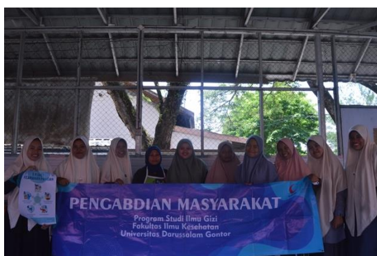
Gambar 3. Foto bersama pengelola kantin

Pelaksanaan kegiatan edukasi dilaksanakan di cluster/ gazebo dengan sasaran pengelola kantin UNIDA Gontor kampus putri. Peserta kegiatan berjumlah 11 orang. Pelaksanaan kegiatan diawali dengan wawancara untuk mengetahui karakteristik peserta meliputi usia, pendidikan terakhir, lama bekerja, dan pernah tidaknya mendapat edukasi serupa sebelumnya. Kemudian responden mengisi soal pretest untuk mengukur tingkat pengetahuan mereka tentang keamanan pangan sebelum pemberian edukasi. Setelah semua peserta mengumpulkan dan menyelesaikan pengisian pretest, dilakukan kegiatan edukasi dalam bentuk penyuluhan dengan media. Setelah pemberian materi, dilanjutkan dengan tanya jawab, diskusi bersama ibu-ibu pengelola kantin untuk menggali pengalaman dan pengetahuannya. Kegiatan terakhir adalah pengisian lembar posttest untuk mengukur tingkat pemahaman setelah mendapatkan intervensi berupa edukasi lima kunci keamanan pangan