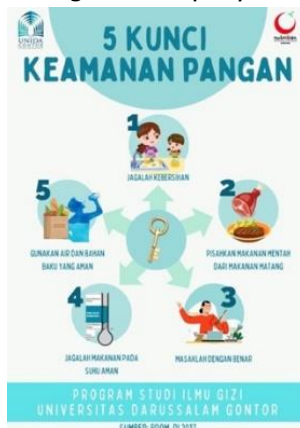
Gambar 2. Media poster yang digunakan untuk pemberian edukasi