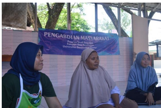
Gambar 5. Peserta sedang menyimak materi yang disampaikan

Keberhasilan peningkatan pengetahuan pengelola kantin sebelum dan setelah diberikan edukasi yang diukur menggunakan uji ttest menyatakan bahwa terdapat peningkatan pengetahuan ( p value < 0,05 ). Hasil uji ttest dapat dilihat pada tabel 1.