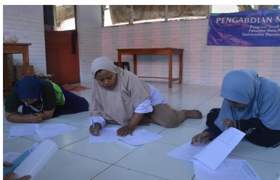
Gambar 4. Peserta sedang mengisi pretest dan posttest