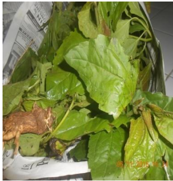
Gambar 3. Chromolaena odorata L