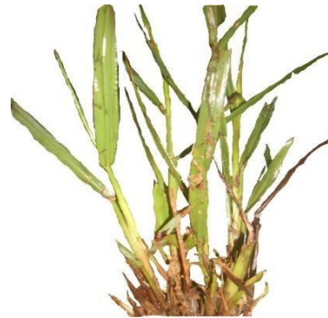
Gambar 2. Axonopus compressus