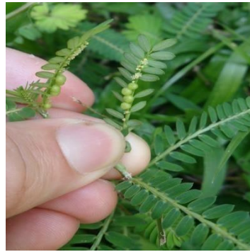
Gambar 4. Phyllanthus amarus

Sutriyono et al. (2009) menyatakan bahwa semakin tinggi nilai SDR suatu spesies maka semakin besar penguasaannya terhadap faktor biotik dan abiotik yang terdapat di lingkungan tersebut. Hal ini menunjukkan bahwa nilai SDR sebesar 34.81% pada Brachiaria reptans mampu menguasai semua faktor biotik dan abiotik sebanyak 34.81% dan Axonopus compressus (8.64%), dan Chromolaena odorata L (6.52%).