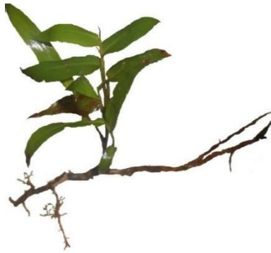
Gambar 1. Brachiaria reptans