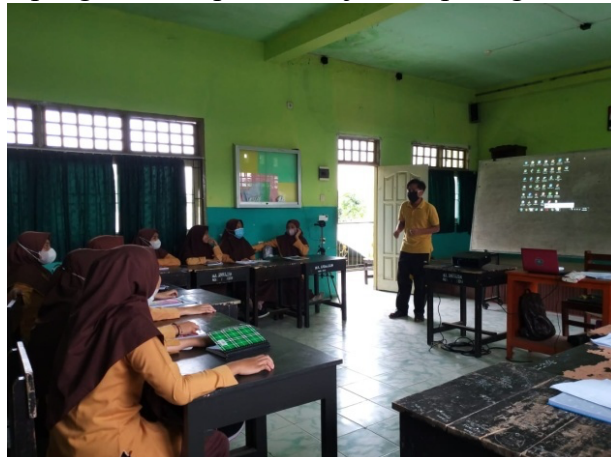
Gambar 1: Peningkatan Character Leadership Santriwati pada era Modern

Kegiatan pengabdian seperti ditunjukkan pada gambar berikut: