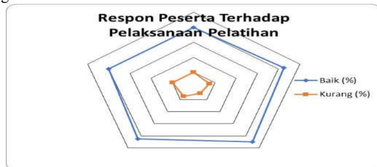
Gambar 2. Respon Peserta terhadap pelaksanaan pelatihan

Evaluasi proses ini berupaya untuk mengetahui tingkat partisipasi, respon, dan pemahaman terhadap materi pelatihan yang disampaikan kepada peserta. Dari sisi partisipasi, yang ditargetkan mengikuti pelatihan ini adalah seluruh komponen atau jajaran guru PAUD. Dalam kenyataannya, hampir semua peserta hadir dan ikut berpartisipasi aktif selama kegiatan pelatihan berlangsung. Kemudian, respon peserta terhadap kegiatan pelatihan ini menunjukkan dukungan yang positif dan memandang perlu untuk mengembangkan kegiatan sejenis yang dapat berkesinambungan. Terkait dengan respon peserta terhadap pelaksanaan kegiatan pelatihan ini, berikut visualisasi dari respon peserta setelah diberikan angket berisi tanggapan terhadap kegiatan pelatihan yang disajikan. Berikut adalah data grafik yang menunjukkan bahwa respon peserta terhadap pelaksanaan pelatihan. (1) Persiapan Pelatihan, peserta menjawab 85% baik dan 15% kurang baik; (2) aspek Pelaksanaan Pelatihan, peserta menjawab 90% Baik dan 10% kurang baik; (3) aspek Kompetensi Pemateri, peserta pelatihan menjawab 90% baik dan hanya 10% kurang; (4) aspek Materi Pelatihan, peserta menjawab 80% baik dan 20% kurang; dan (5) aspek Media Pelatihan, peserta menjawab 90% baik dan 10% kurang.