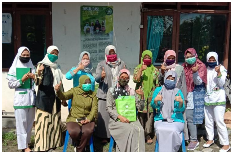
Gambar 2. Bersama Bidan dan kader Kesehatan Desa Sumbertlaseh Kecamatan Dander Kabupaten Bojonegoro serta mahasiswa Stikes Rajekwesi Bojonegoro