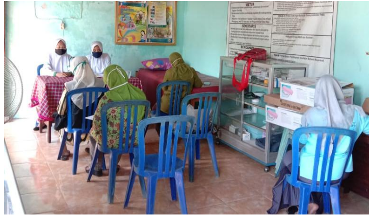
Gambar 1. Pemberian Penyuluhan pada kader kesehatan