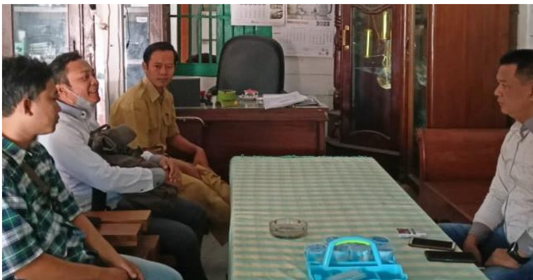
Gambar 1. Diskusi antara tim pengabdian, kepala desa, dan perangkat desa Pacing

dan numerasi pernah di laksanakan di masing-masing sekolah setelah pembelajaran dilakukan secara luring mulai tanggal 19 Juni 2022 lalu.