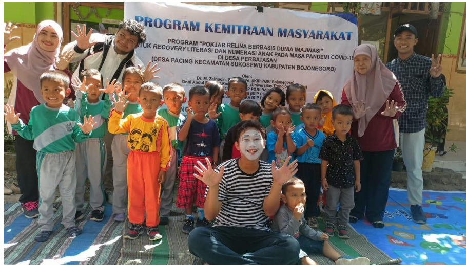
Gambar 3. Salah satu kegiatan pengabdian yang melibatkan guru sebagai observer

yang hadir. Peran guru tersebut selaku observer pembelajaran agar kualitas pembelajaran dapat diperbaiki pada setiap pertemuan. Berikut foto kegiatan bersama guru sebagai observer.