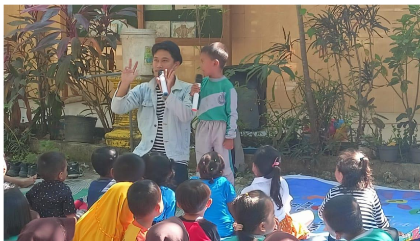
Gambar 2. Kegiatan inti pengabdian dengan materi bilangan asli

Tabel 2. Menunjukkan bahwa pengabdian kepada masyarakat ini dilakukan berdasarkan suatu tema dan tetap memperhatikan usia anak. Konten dalam pertunjukan tersebut dikemas dalam hal yang sederhana, sehingga tidak seperti pada materi dalam buku pelajaran yang digunakan anak di sekolah. Misalnya dalam materi penjumlahan, pantomime memperagakan gerakan membeli 4 bakso kemudian memberikan 1 baksonya ke peserta. Di akhir pertunjukan, pantimimer mengkonfirmasi sisa bakso yang dimiliki. Berikut gambaran suasana pantomime di salah satu kelompok belajar. Berikut salah satu foto kegiatan pengabdian.