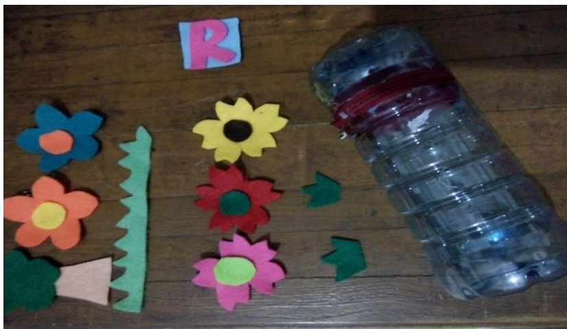
Gambar 3. Hasil potongan kain flanel salah satu kelompok

Tim PKM memberikan kebebasan kepada masing-masing kelompok untuk menghias botol sesuai dengan imajinasi mereka.