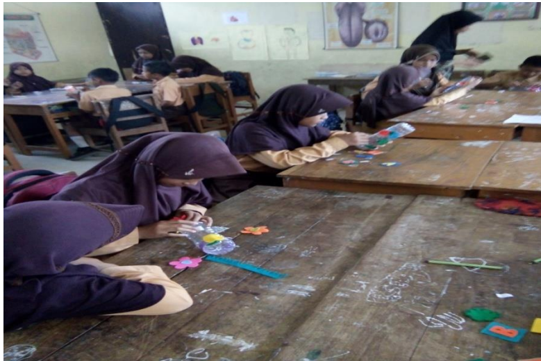
Gambar 4. Proses menempel kain flanel pada botol