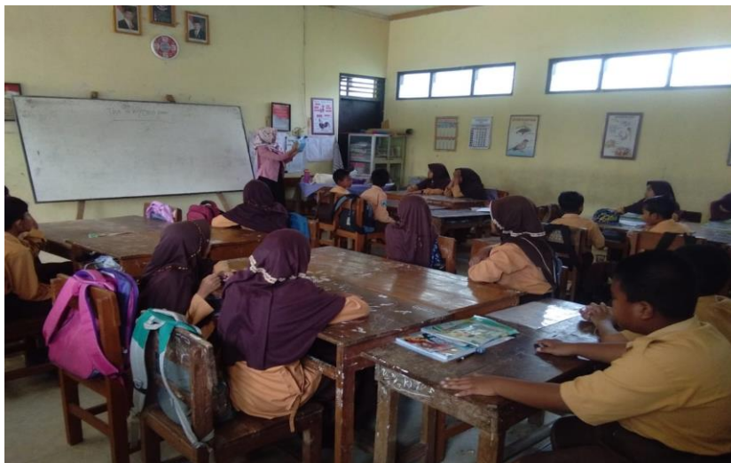
Gambar 1. Antusias siswa saat mendengarkan ceramah