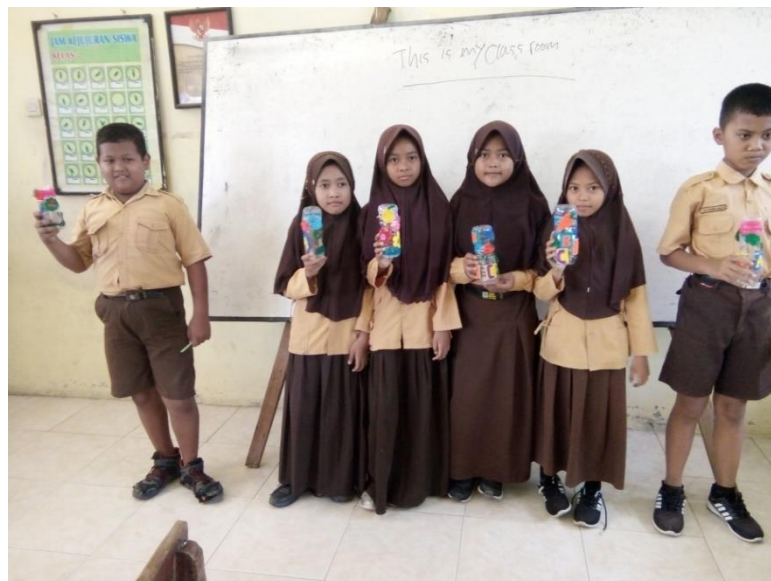
Gambar 5. Hasil botol bekas yang sudah dihias dengan kain flanel

Berdasarkan pengamatan selama kegiatan berlangsung yaitu pengabdian kepada masyarakat diperoleh hal-hal yang positif, yaitu : Siswa benar-benar mendengarkan materi yang disampaikan oleh Tim PKM mengenai cara membuat tempat pensil dari botol plastik, mulai dari pemotongan botol, pemasangan resleting sampai pada menggantung kain flanel sebagai penghias botol, siswa menunjukkan sikap positif dan rasa ketertarikan dalam pembuatan tempat pensil dari botol plastik, siswa mengikuti arahan dan mampu melakukan kerja sama yang baik dengan kelompoknya masing-masing sehingga mampu menyelesaikannya dalam waktu yang sudah Tim PKM tentukan, siswa aktif bertanya secara bergantian apabila belum memahami dalam pembuatan tempat pensil dari botol plastik, siswa sejumlah 6 orang dalam satu kelompok selain bekerja sama dalam membuat tempat pensil disini Tim PKM memberikan kesempatan kepada masing-masing siswa untuk membuat tempat pensil