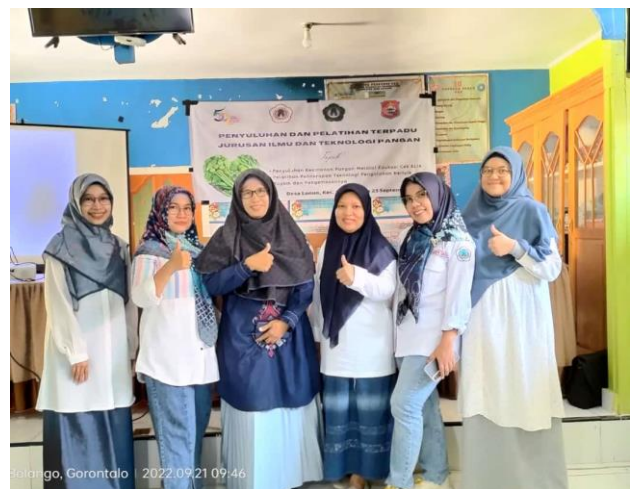
Gambar 1: Masyarakat Desa Lonuo dan Tim Pelatih dari Jurusan Ilmu dan Teknologi Pangan FAPERTA UNG