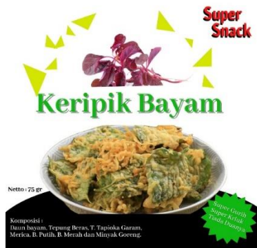
Gambar 2. Desain Kemasan Keripik Bayam Desa Lonuo

Kemasan Keripik bayam yang dihasilkan oleh masyarakat di Desa Lonuo dapat dilihat pada gambar 2 di bawah ini :