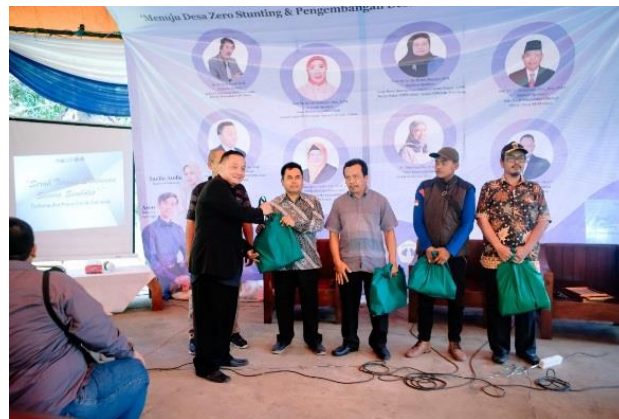
Gambar 2. Pembagian Simbolis Paket Sembako Oleh Ketua Dosen Peneliti PDPI Cianjur