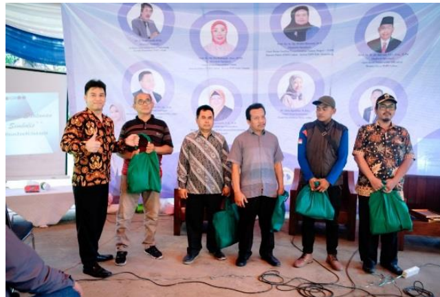
Gambar 1. Pembagian Simbolis Paket Sembako Oleh Ketua Dosen Peneliti PDPI Jawa Barat