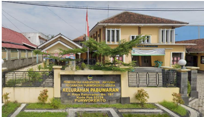
Gambar 2. Lokasi Kelurahan Pabuwaran