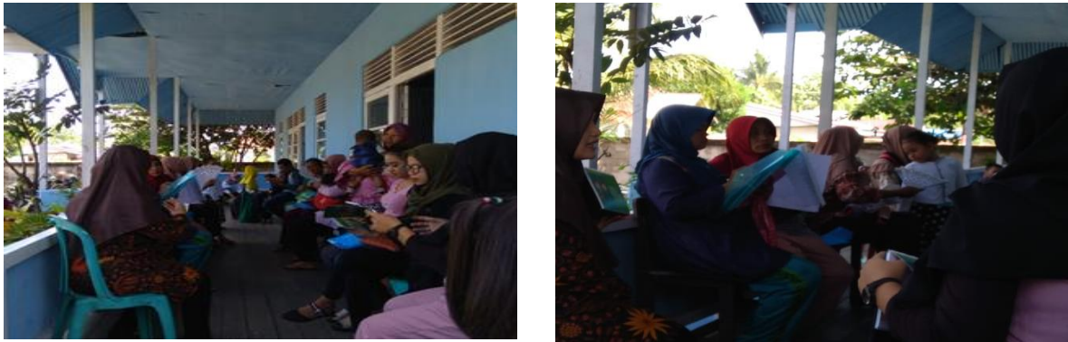
Gambar 4. Kegiatan Penyuluhan Gizi Pada Ibu

(2021) Flip chart merupakan salah satu alat bantu pendidikan yang sangat sederhana dan cukup efektif untuk digunakan dalam menyampaikan informasi termasuk dalam menyampaikan pesan kesehatan. Selain itu, peserta juga antusias dalam mengikuti kegiatan sehingga pemahaman peserta pun baik. Berikut suasana kegiatan pelaksanaan kegiatan penyuluhan pengetahuan gizi Ibu, pada Gambar 4.