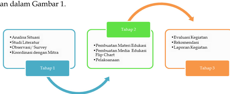
Gambar 1. Tahap Pelaksanaa Kegiatan PKM

Kegiatan penyuluhan gizi ini dilakukan sebagai bentuk pelaksanaan pengabdian kepada masyarakat yang ditujukan pada Ibu-ibu rumah tangga yang memiliki anak balita atau Ibu hamil yang ada di wilayah kerja puskesmas tuan-tuan di desa suka baru. Kegiatan dilaksanakan pada bulan Juni-Juli 2019 bertempat di ruang posyandu dan Puskesmas Pembantu (Pustu) Desa Suka Baru, Kec. Benua Kayong, Kabupaten Ketapang. Metode pelaksanaan kegiatan penyuluhan stunting ini berupa ceramah dengan media flip chart dilakukan oleh Ibu Uliyanti, S.TP, M.Gizi selaku ketua tim pengabdian kepada masyarakat dan sebagai peserta kader Posyandu dan perwakilan warga masyarakat di desa suka baru. Pelaksanaan kegiatan terbagi menjadi 3 tahap yaitu persiapan, pelaksanaan, dan tahap evaluasi dan Finalisasi. Adapun tahapan pelaksanaannya penyuluhan ini seperti yang ditunjukkan dalam Gambar 1.