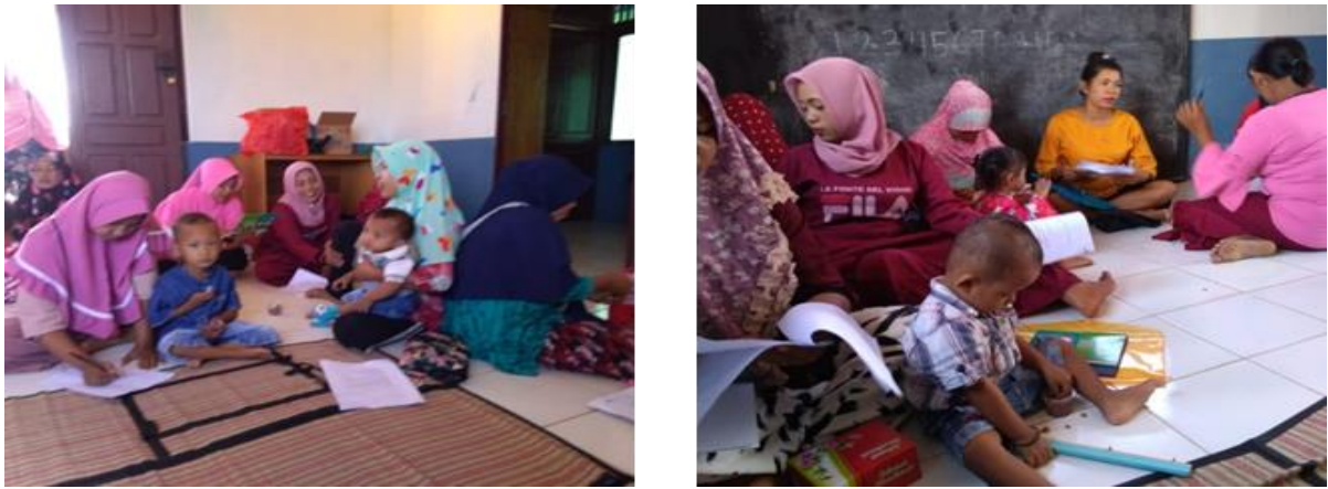
Gambar 1. Kegiatan pre test dan post test sebelum dan sesudah kegiatan penyuluhan gizi

Menurut Atmarita dan Fallah (2004) bahwa pendidikan gizi diberikan untuk menambah pengetahuan. Untuk itu, dalam upaya menurunkan kejadian stunting, masyarakat perlu diberikan pengetahuan gizi melalui kegiatan pendidikan gizi agar meningkatkan pengetahuannya tentang gizi seimbang. Pengetahuan adalah hasil tahu dan ini terjadi setelah orang melakukan penginderaan terhadap obyek tertentu (Uliyatul Laili dan Ratna Ariesta Dwi Andriani, 2019). Pengetahuan juga dapat diperoleh dengan melihat, mendengar sendiri atau melalui alat-alat komunikasi, seperti membaca surat kabar dan majalah, mendengar siaran radio, dan menyaksikan siaran televisi maupun melalui penyuluhan kesehatan/ gizi. Semakin banyak jenis dan informasi tentang gizi dan kesehatan yang diterima seseorang, maka semakin luas wawasan dan pengetahuan tentang hal tersebut, sehingga akan merubah perilaku dalam menentukan pola asupan gizi.