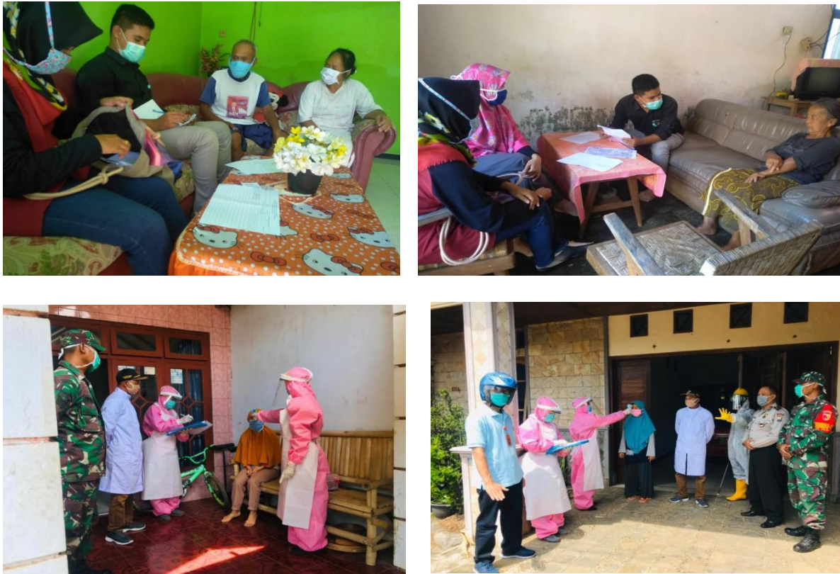
Gambar 1. Dokumentasi Kegiatan pendataan warga pendatang dan/atau setelah bepergian dari wilayah zona merah

Promosi Kesehatan Upaya Pencegahan COVID 19 Bekerja Sama Dengan Relawan Mahasiswa dan Desa Dilem