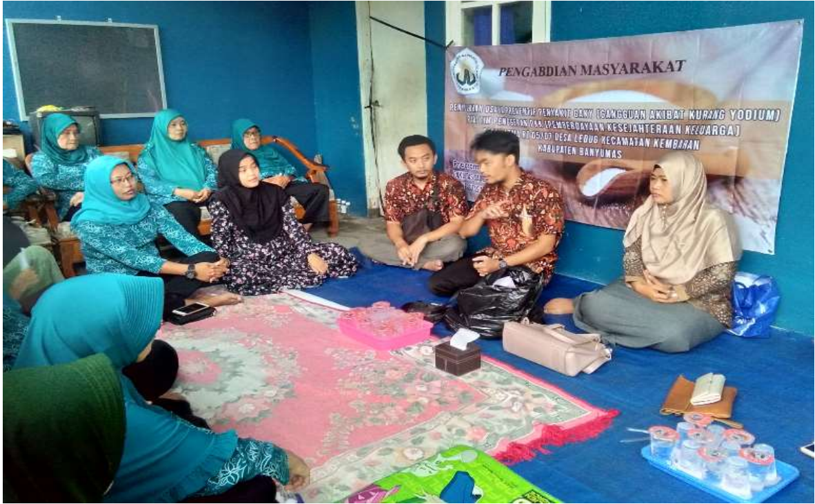
Gambar 1. Penyuluhan penyakit GAKY dan pentingnya konsumsi garam beryodium sebagai usaha preventif, penyuluhan ini dilakukan pada tim kelompok PKK Desa Ledug

dengan garam dapur tersebut memberikan hasil yang berbeda, dimana garam merk A menggambarkan kandungan iodine yang tinggi (lebih pekat / +++) dibandingkan garam lainnya.