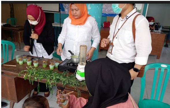
Gambar 7. program diversifikasi makanan tambahan dari sumber pangan lokal