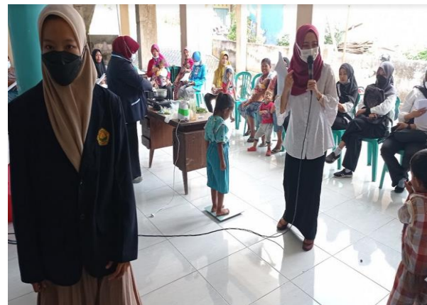
Gambar 4. Pendidikan kesehatan tentang stimulasi tumbuh kembang balita, dan kelas parenting