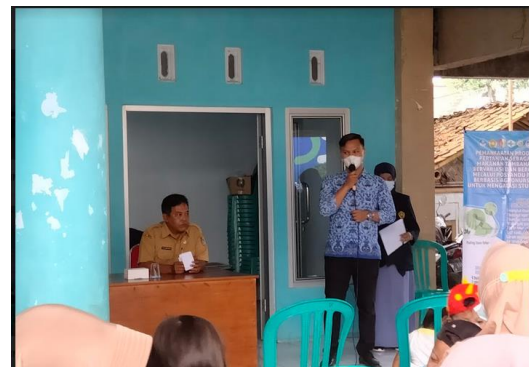
Gambar 10. penguatan kemitraan dalam pengembangan posyandu plus berbasis agronursing bersama tenaga kesehatan Desa Patemon