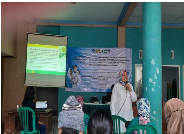
Gambar 3. pendidikan kesehatan tentang stunting.

Program penerapan pemanfaatan produk pertanian sebagai makanan tambahan bervariasi dan bergizi melalui Posyandu Plus berbasis agronursing didesiminasikan kepada mitra sebagai suatu bentuk teknologi inovatif yang membantu mengatasi permasalahan stunting di lokasi mitra dengan memanfaatkan produk hasil pertanian yang ada di sekitar. Program ini dijalankan bersama dengan kegiatan posyandu yang rutin dilakukan di kedua desa mitra. Pengintegrasian program ini dengan posyandu yang ada di lokasi mitra diaplikasikan dalam bentuk posyandu PLUS berbasis agronursing. Program ini menjadi rumah utama dari program pemanfaatan produk pertanian sebagai pemberian makanan tambahan bervariasi dan bergizi.