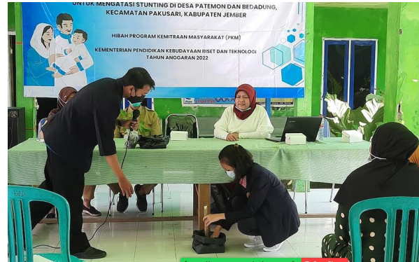
Gambar 8. Program diversifikasi pangan lokal dan cara penanamannya

Agronursing merupakan penatalaksanaan manajemen pelayanan keperawatan dan asuhan keperawatan dengan ruang lingkup agricultural (pertanian, perkebunan, perikanan, peternakan serta agroindustri) berfokus pada klien secara holistik dan komprehensif (Susanto, 2022). Penambahan aktivitas (Plus) dalam posyandu Plus adalah aktivitas pemberdayaan kader dan ibu-ibu posyandu untuk dapat memanfaatkan produk hasil pertanian sebagai makanan tambahan bergizi dan bervariasi. Pemberdayaan dilakukan dengan serangkaian kegiatan pelatihan yang intensif selama 3 bulan. Program pemberdayaan pemanfaatan hasil pertanian sebagai makanan tambahan bervariasi dan bergizi pada kader dan ibu-ibu ini mampu memperkuat ketahanan komunitas Desa Patemon dan Desa Bedadung dalam mengatasi permasalahan stunting yang cukup tinggi.