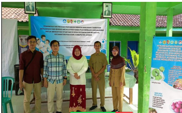
Gambar 9. penguatan kemitraan dalam pengembangan posyandu plus berbasis agronursing bersama tenaga kesehatan Desa Bedadung

Agronursing merupakan penatalaksanaan manajemen pelayanan keperawatan dan asuhan keperawatan dengan ruang lingkup agricultural (pertanian, perkebunan, perikanan, peternakan serta agroindustri) berfokus pada klien secara holistik dan komprehensif (Susanto, 2022). Penambahan aktivitas (Plus) dalam posyandu Plus adalah aktivitas pemberdayaan kader dan ibu-ibu posyandu untuk dapat memanfaatkan produk hasil pertanian sebagai makanan tambahan bergizi dan bervariasi. Pemberdayaan dilakukan dengan serangkaian kegiatan pelatihan yang intensif selama 3 bulan. Program pemberdayaan pemanfaatan hasil pertanian sebagai makanan tambahan bervariasi dan bergizi pada kader dan ibu-ibu ini mampu memperkuat ketahanan komunitas Desa Patemon dan Desa Bedadung dalam mengatasi permasalahan stunting yang cukup tinggi.