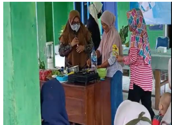
Gambar 6. Pemberdayaan Kader dan Ibu-ibu dalam pembuatan makanan tambahan bersumber pangan lokal di Desa Bedadung