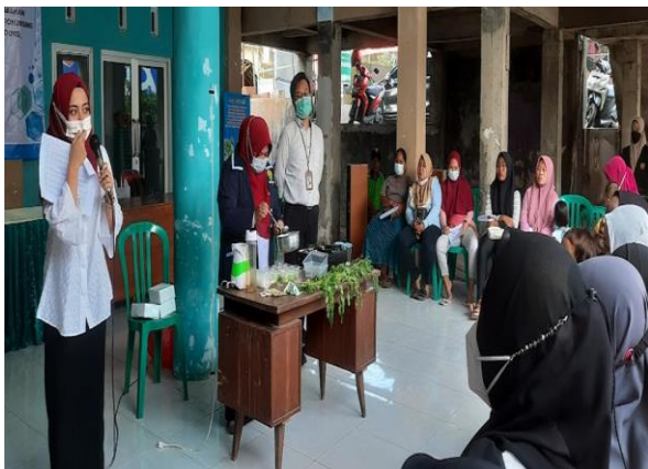
Gambar 5. Pemberdayaan Kader dan Ibu-ibu dalam pembuatan makanan tambahan bersumber pangan lokal di Desa Patemon