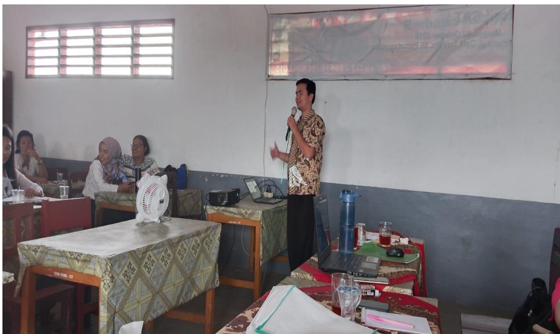
Gambar 3. Penyampaian materi oleh narasumber

Pada Pengabdian yang dilakukan oleh dosen kepada Guru-guru SD Negeri 091488 Pematangsiantar adalah bentuk referensi dari hasil penelitian penulis yang telah berhasil dalam pengaplikasiannya disekolah, dengan menerapkan hasil penelitian kepada pengabdian masyarakat yang di sosialisasikan maka dengan adanya pengabdian ini Para Guru SD Negeri 091488 Pematang Siantar semakin tau tahu Pengaplikasian Kurikulum Merdeka upaya peningkatan mutu proses pembelajaran yang dilakukan oleh guru kepada siswa.