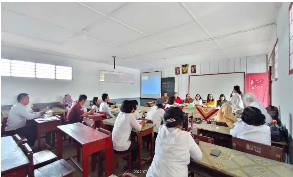
Gambar 2. Kegiatan PKM Penyuluhan Materi Implementasi Kurikulum pada Guru-guru

Kegiatan sosialisasi dan pelatihan di SD Negeri 091488 Pematangsiantar bertujuan untuk memberikan informasi kepada guru terkait aplikasi yang dapat digunakan dalam kegiatan pembelajaran sebagai implementasi kurikulum merdeka belajar sehingga kegiatan pembelajaran termasuk saat evaluasi menjadi lebih praktis, efektif dan menarik.