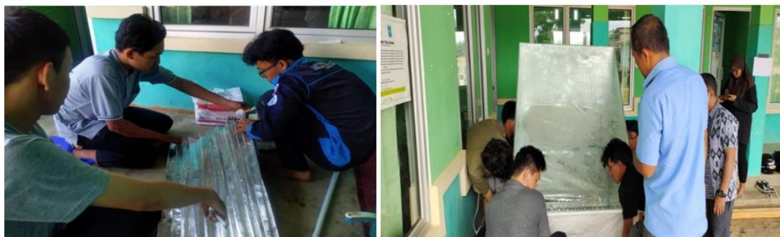
Gambar 3. Proses pembuatan alat destilasi

Kegiatan dilanjutkan dengan realisasi pembuatan alat destilasi. Pembuatan alat destilasi dilaksanakan di Desa penyak selama kurang lebih 5 hari. Dalam proses pembuatannya, tim Bina Desa HMF melibatkan beberapa warga yang bersedia membantu dengan sukarela. Gambar 3 adalah kegiatan yang dilakukan oleh tim bersama dengan beberapa masyarakat yang terlibat. Setelah alat destilasi dibuat, maka dilanjutkan dengan uji coba. Berdasarkan hasil pengujian yang dilakukan, dalam satu hari dapat menghasilkan kurang lebih 1 liter air bersih. Secara visual air tersebut sangat jernih, namun perlu dilakukan pengujian lebih lanjut untuk menguji kualitas air hasil destilasi tersebut.