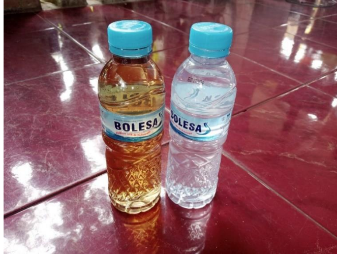
Gambar 4. Gambar air sebelum (kiri) dan sesudah (kanan) didestilasi

Air yang dikatakan layak untuk memenuhi kebutuhan sehari-hari memiliki suatu persyaratan yang harus dipenuhi [9]. Analisis kualitas air perlu dilakukan menggunakan metode STORET dan Indeks Pencemaran. Melalui analisis STORET dan Indeks Pencemaran, maka akan diketahui parameter-parameter kimia dan fisika sehingga dapat disimpulkan apakah air yang dihasilkan layak konsumsi atau tidak [10]. Gambar 4 adalah gambar air sebelum (kiri) dan sesudah (kanan) didestilasi.