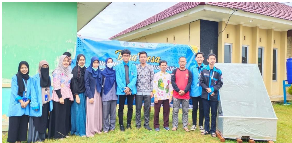
Gambar 5. Kegiatan Penutupan