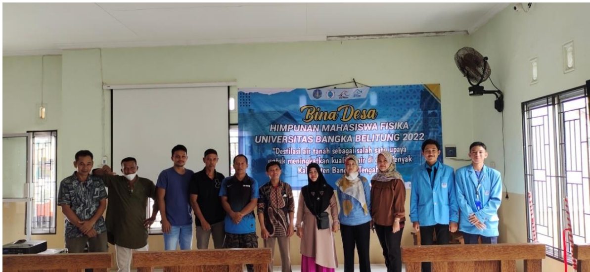
Gambar 2. Materi dan pembukaan Bina Desa di Kantor Desa Penyak Pelaksanaan kegiatan

Kegiatan dilanjutkan dengan realisasi pembuatan alat destilasi. Pembuatan alat destilasi dilaksanakan di Desa penyak selama kurang lebih 5 hari. Dalam proses pembuatannya, tim Bina Desa HMF melibatkan beberapa warga yang bersedia membantu dengan sukarela. Gambar 3 adalah kegiatan yang dilakukan oleh tim bersama dengan beberapa masyarakat yang terlibat. Setelah alat destilasi dibuat, maka dilanjutkan dengan uji coba. Berdasarkan hasil pengujian yang dilakukan, dalam satu hari dapat menghasilkan kurang lebih 1 liter air bersih. Secara visual air tersebut sangat jernih, namun perlu dilakukan pengujian lebih lanjut untuk menguji kualitas air hasil destilasi tersebut.