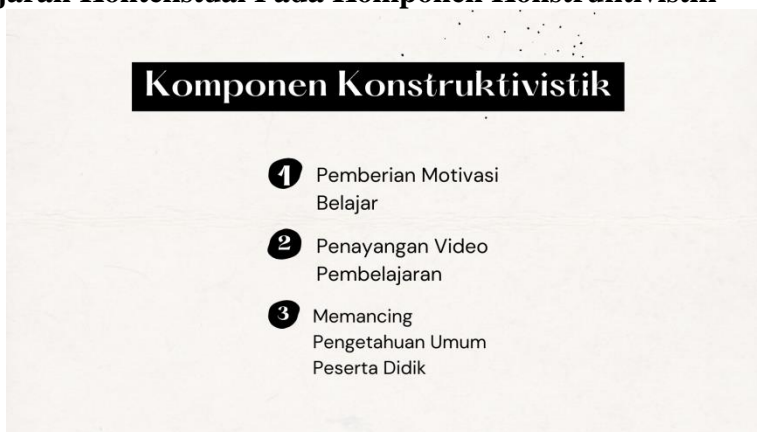
Gambar 1. Strategi Komponen Konstruktivistik

Dimulai dari konstruktivistik ( constructivism ) pada tahap ini, pendidik akan memulai pembelajaran menjelaskan topik yang akan dipelajari. Mengawalinya dengan memberikan motivasi belajar agar peserta didik dapat bersemangat, dilanjut dengan pengenalan teks eksposisi, tujuan dari teks eksposisi, unsur kebahasaan teks eksposisi. Pemberian motivasi belajar ini diberikan berupa mengajak peserta didik menyaksikan video pembelajaran mengenai Teks Eksposisi secara bersama-sama memanfaatkan proyektor apabila kelas dilakukan secara luar jaringan (luring) atau dapat membagikan pranala video pembelajaran dan juga menayangkan secara bersama-sama dengan memanfaatkan fitur berbagi layar.