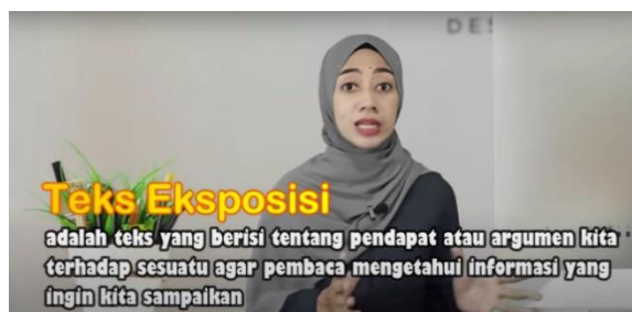
Gambar 2. Contoh Video Pembelajaran Teks Eksposisi Arisa Nur Aini

dengan hasil penelitian yang pernah dilakukan oleh Kamlin & Keong (2020) bahwa video menjadi platform penyampaian yang efektif dalam pembelajaran. Kini telah hadir banyak pilihan video pembelajaran yang tersedia di YouTube dapat dipilih.