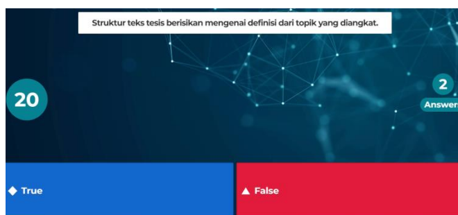
Gambar 6. Contoh pertanyaan menjebak.

Seusai tahap bertanya dan komunitas dilakukan, maka dilanjut dengan tahap pemodelan ( modeling ). Pada tahap ini, pendidik dapat menguji kemampuan menyimak peserta didik selama pembelajaran berlangsung. Pengujian yang dilakukan memanfaatkan media Kahoot. Pertanyaan-pertanyaan yang ditampilkan berkaitan dengan informasi yang telah diterima di tahap konstruktivistik sampai dengan tahap komunitas belajar. Adapun pertanyaan yang ditanyakan diharapkan condong kepada menguji kemampuan menyimak peserta didik. Pertanyaan menjebak sekaligus mengasah berpikir kemampuan kritis peserta didik juga perlu dibuat. Adapun contoh satu contoh pertanyaan menjebak yang bisa digunakan, struktur teks tesis berisikan mengenai definisi dari topik yang diangkat, jawaban untuk pertanyaan ini adalah salah. Alasannya adalah tesis berisikan pengenalan isu yang akan disampaikan di dalam teks eksposisi, mengenalkan dengan definisi adalah dua hal yang berbeda.