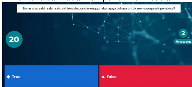
Gambar 5. Visualisasi Kahoot.