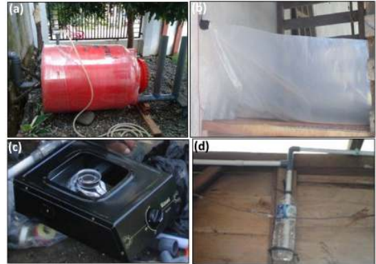
Gambar 4. Instalasi biogas sistem kontinu

dengan pemasangan pipa feed keluar. Pipa feed keluar dirancang berbentuk S. Tujuannya agar mudah menampung feed yang keluar. Tinggi pipa feed keluar harus disesuaikan dengan tinggi feed dalam digester sehingga tidak menyumbat gas keluar. Setelah itu dipasang pipa untuk menyalurkan gas yang terbentuk ke penampung gas. Pada tahap akhir pembuatan digester dilakukan pengecekan kebocoran dengan menggunakan air.