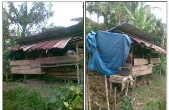
Gambar 2. Kadang sapi milik salah satu warga Desa Sukasari

terbuang sebagai limbah yang justru menyebarkan penyakit bagi masyarakat sekitar.