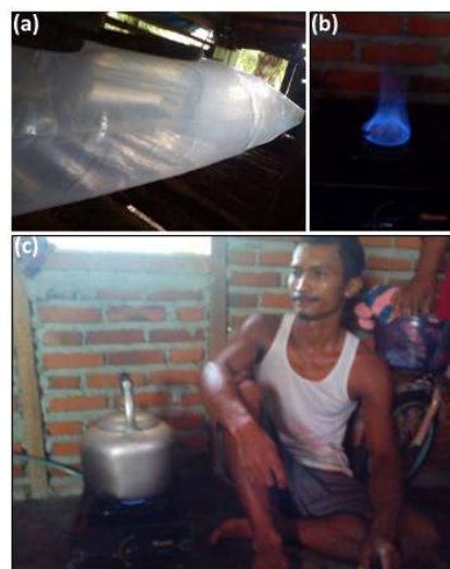
Gambar 6. Biogas yang dihasilkan, a) Penggelembungan penampung gas, b) api dari biogas, c) penggunaan biogas untuk memasak

Sehingga pada masa yang akan datang muncul instalasi biogas baru yang lebih banyak. Sehingga masyarakat tidak lagi tergantung pada gas. Akhirnya masalah kelangkaan dan kenaikan gas dapat teratasi.