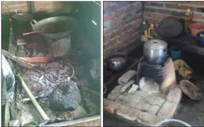
Gambar 1. Kondisi dapur salah satu warga Desa Sukasari

memecahkan persoalan yang dihadapi oleh masyarakat Desa Sukasari dengan memanfaatkan potensi lokal yang ada.