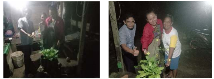
Gambar 3. Sawi hijau saat dipanen

Pada Gambar 3, diperlihatkan hasil panen sawi hijau setelah berumur \pm 45 hari. Setiap polybag massa sawi hijau yang dipanen rata-rata mencapai 300 gram. Sawi hijau terlihat sangat subur dan memiliki pertumbuhan yang cepat jika dibandingkan dengan teknik penanaman secara tradisional. Pasca panen, tahapan yang dilakukan pada serangkaian pengabdian ini adalah melakukan monitoring dan evaluasi kegiatan pembinaan. Selain memperoleh hasil panen tanaman sawi hijau, kemudahan dan kendala khalayak sasaran menjadi bahan diskusi berikutnya. Kepada khalayak sasaran, tim pengabdian memberikan post-test sebagai dasar evaluasi pemahaman khalayak sasaran dalam membangun dan menerapkan teknologi irigasi kapilaritas. Berdasarkan hasil post-test diperoleh bahwa khalayak sasaran sangat antusias terhadap kemanfaatan teknologi ini. Proses penanaman dan perawatan tanaman sawi hijau menjadi lebih mudah dan lebih hemat jika dibandingkan dengan Teknik penanaman secara konvensional. Secara statistik, 100% khalayak sasaran telah mampu secara mandiri membuat, menerapkan, dan memodifikasi teknologi irigasi kapilaritas. Teknologi ini dinilai telah mampu memberikan kemudahan khalayak sasaran dalam menerapkan teknologi tepat guna.