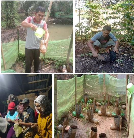
Gambar 2. Persiapan media tanam (a dan b), (c) Pembuatan sumbu kapilaritas dari karpet bersama khalayak sasaran, dan (d) Pagar waring tempat polybag .

kapilaritas. Selanjutnya adalah pengaturan untuk meletakkan sumbu kapilaritas pada botol aqua. Pada bagian akhir kegiatan, mitra akan memperoleh dan mengkonsumsi sayuran sawi hijau dari hasil teknologi irigasi kapilaritas.