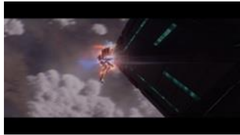
Gambar 6. Salah satu adegan dimana Captain Marvel menghentikan rudal raksasa pasukan Kree dengan kekuatan supernya.

mengalahkan berbagai musuh dari bangsa Skrull dan pasukan Kree, serta ia berhasil menghancurkan pesawat-pesawat penghancur pasukan Kree.