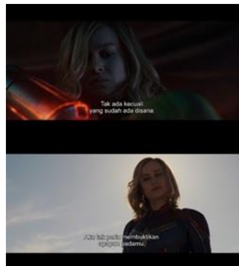
Gambar 3. Beberapa contoh adegan dalam Captain Marvel yang diambil dengan teknik low-angle .

Temuan denotatif pertama dalam penelitian yaitu, Captain Marvel sebagian besar dalam film ditampilkan di depan karakter lain dengan arah angle pengambilan gambar secara low-angle ke arahnya. Pengambilan gambar seperti ini merupakan posisi pengambilan gambar lebih rendah dibandingkan objek.