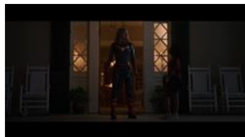
Gambar 8. Adegan di saat Captain Marvel mengganti warna kostumnya sesuai dengan warna dari lambang US Air Force.

Setelah ingatannya kembali, Captain Marvel mengganti warna pakaiannya yang semula hijau dan merupakan warna bangsa Kree menjadi warna sesuai dengan lambang US Air Force, yaitu warna kuning keemasan, biru, dan merah sebagai warna kostum barunya. Warna ini dipilih ketika ia bersama dengan anak perempuan dari sahabatnya yang mengenakan kaos dengan lambang US Air Force.