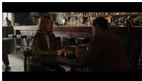
Gambar 9. Salah satu adegan di saat Captain Marvel berdiskusi dengan Nick Fury.

Meskipun Captain Marvel sering ditampilkan sebagai karakter yang lebih kuat dibandingkan karakter laki-laki dalam film, juga terdapat berbagai adegan yang menunjukkan kesetaraan antara Captain Marvel dengan salah satu karakter laki-laki yaitu Nick Fury. Ketika terdapat adegan bersama dengan Nick Fury, sering kali teknik pengambilan gambar yang digunakan adalah eye-level-angle , yaitu posisi pengambilan gambar yang sejajar atau setara dengan objek yang diambil (Ertanti, 2016).