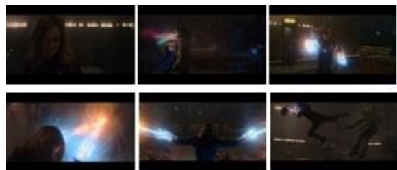
Gambar 7. Salah satu adegan dimana Captain Marvel berkelahi dengan sekelompok pasukan Kree secara bersamaan.

Selain itu, dalam film, Captain Marvel diceritakan memiliki kemampuan bela diri yang luar biasa, ia selalu dapat mengalahkan musuh-musuh yang menghalanginya, baik secara perorangan maupun berkelompok. Sering kali Captain Marvel ditampilkan melawan musuhnya yang menyerang secara berkelompok dan selalu berhasil ia kalahkan.