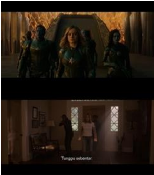
Gambar 4. Beberapa contoh adegan dalam Captain Marvel di mana posisi Captain Marvel berada di depan karakter lainnya.

Selain sering ditampilkan melalui teknik pengambilan gambar low-angle , Captain Marvel juga sering kali ditampilkan berdiri di depan karakter lainnya dalam film atau berada di tengah-tengah layar.