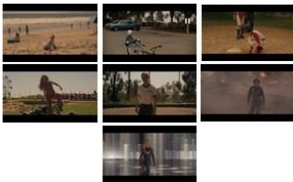
Gambar 5. Beberapa contoh adegan dalam Captain Marvel di mana ia selalu bangkit berdiri setelah jatuh atau gagal.

Temuan denotatif kedua adalah Captain Marvel selalu digambarkan berdiri kembali ketika terjatuh atau gagal. Dalam film, Captain Marvel diceritakan sering mengalami kegagalan sejak ia masih kecil hingga ia menjadi dewasa. Setelah ia mengalami kegagalan, ia selalu bangkit dan kembali berdiri.