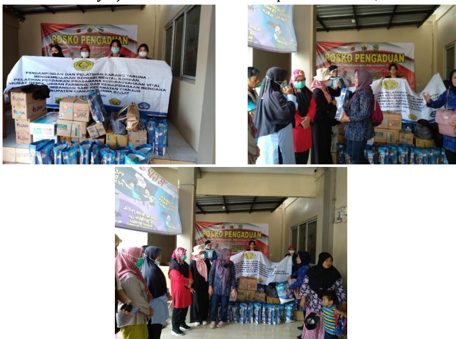
Gambar 4. Sumbangan untuk posyandu dan balita, ibu hamil dan menyusui (makanan, vitamin, susu, obat-obatan)

Gambaran tentang kemampuan para peserta akan penggunaan Aplikasi e-kuliner musi ini peserta diminta untuk mengisi kusioner yang sudah disiapkan dan diberikan kepada khususnya pemilik usaha, para pekerjanya yang berjumlah 4 orang adapun untuk pertanyaan evaluasi yang diajukan yakni: