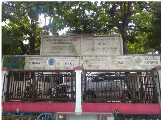
Gambar 1. Kondisi bangunan yang hancur dan lokasi Pengabdian

Untuk meringankan penderitaan korban bencana alam di tempat pengungsian masyarakat yakni Pemerintah dapat berkoordinasi melalui rancangan dalam pemberian atau penyediaan makanan darurat. Melihat kondisi yang tidak dapat hidup normal maka sangat dibutuhkannya penyediaan makanan darurat ( ready to eat ). Makanan yang diberikan seharusnya tidak hanya sekedar menjadi makanan ringan saja atau penganjal perut tetapi menjadi pengganti fungsi menu sarapan dan menu makanan lengkap yang cukup memeberikan energi tambahan. Mie instan sekarang ini menjadi makanan pokok utama bagi masyarakat pengungsi. Satu Bungkus mie instan mengandung sekitar 300 kalori. Hanya 15% kalori dari yang diperlukan oleh para pengungsi. Pengungsi yang mengalami beban fisik, stress oksidatif dan kelelahan kondisi mental diberikan mie instan hanya akan dapat menurunkan daya tahan dan vitalitas para pengungsi. Karena didalam kandungan mie instan terdapat bahan adiktif yakni zat pengawet serta zat penyedap rasa yang mengakibatkan dampak buruk bagi masyarakat pengungsian. Belum Lagi mie instan yang datang ke pengungsian tidak