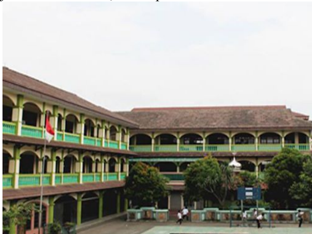
Gambar 1. Sekolah Tinggi Teknologi (STT) Yuppentek Kota Tangerang

Kemajuan teknologi informasi dan komunikasi telah membawa pengaruh terhadap penggunaan alat-alat bantu di sekitar kita. Seiring dengan kemajuan teknologi informasi dan komunikasi maka perkembangan semakin lama semakin mengalami perubahan dan mendorong berbagai usaha perubahan. Dengan berkembang pesatnya teknologi informasi dan komunikasi ini juga pada saat ini banyak sekali dimanfaatkan baik itu dalam kehidupan sehari-hari, instansi pemerintahan, perusahaan swasta maupun pada instansi pendidikan yang berlomba-lomba memaksimalkan penggunaan teknologi ini untuk membantu memudahkan pekerjaan mereka tak terkecuali lingkungan perguruan tinggi yang menjadi pondasi pendidikan bagi para akademisi dalam menuntut ilmu [1] . Adapun tujuan dari dilakukannya penelitian pengabdian masyarakat ini yaitu untuk membantu para dosen dan juga staff yang ada pada Sekolah Tinggi Teknologi (STT) Yuppentek Kota Tangerang untuk memanfaatkan penggunaan teknologi informasi dan komunikasi dalam hal penanganan, pengelolaan serta publikasi artikel ilmiah secara terkomputerisasi, berjalan secara online, dan dapat dilakukan secara lebih optimal [2] .