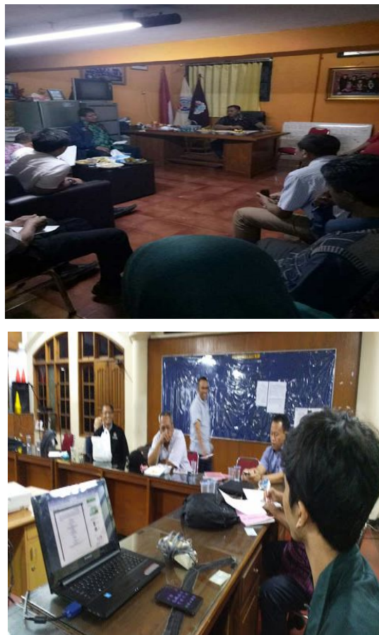
Gambar 3. Proses Pembinaan dan Pelatihan Pengelola Jurnal STT Yuppentek Tangerang

Pengabdian ini dilaksanakan selama kurun waktu 3 bulan terhitung dari bulan Oktober hingga bulan Desember tahun 2018. Dimana kegiatan pelatihan dilakukan secara rutin atau berkala pada setiap satu minggu sekali di ruang dosen Sekolah Tinggi Teknologi Yuppentek Tangerang guna melakukan pembinaan serta praktek langsung penggunaan aplikasi Open Journal System untuk mengelola dan menyimpan serta mempublikasikan karya ilmiah dalam bentuk jurnal penelitian milik Sekolah Tinggi Teknologi (STT) Yuppentek Tangerang. Adapun para pengelola jurnal yang hadir dalam pertemuan sebanyak kurang lebih 20 dosen dan juga staff pengajar di STT Yuppentek Tangerang [11].