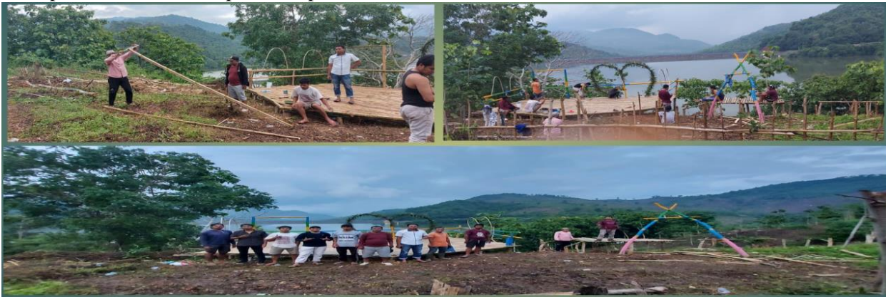
Gambar. 1. Proses Pembuatan Spot Foto Desa Pela Kec. Monta Kab. Bima

Proses mendapatkan pemetaan potensi wisata berbasis olahraga dengan cara survei lapangan dan Focus Group Discussion (FGD) dengan Dinas Pariwisata, akademisi, kepala desa, tokoh adat/agama. Survei lapangan dilakukan pada area sisi timur, barat, selatan, utara dari sisi danau dam pela parado. Survei area potensi olahraga air dilakukan di sepanjang sungai pela dimulai dari dam pela sampai batas Desa Pela. Pembentukan kelembagaan Pokdarwis melalui pemilihan calon pengurus Pokdarwis atas arahan dari Kepala Desa Pela. Selanjutnya dilakukan workshop kelembagaan tata kelola pokdarwis, pembentukan struktur pengurus dan AD/ART, serta mendaftarkan ke Dinas Pariwisata Kabupaten Bima. Pemandu wisata dilakukan dengan merekrut calon pemandu wisata dan pelatihan pemandu wisata.