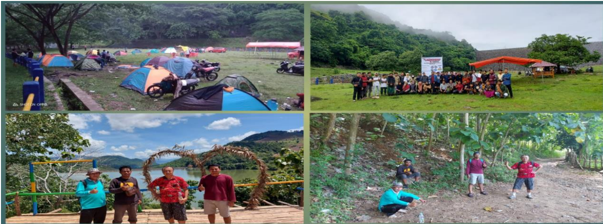
Gambar 5. Kegiatan camping hiking di desa pela

Kegiatan Camping merupakan salah satu paket wisata olahraga yang berada di lapangan DAM pela parado. Camping dilaksanakan pada setiap hari sabtu dan minggu oleh masyarakat, karena lokasi camping yang strategis yang di kelilingi oleh rindangnya pohon di sebelah timur, sedangkan di sebelah barat langsung danau dam pela. Di sebelah utara dan selatan di apit oleh sungai, namun lokasi ini jauh dari musibah bencana serta tingkat keamanan untuk camping sangat terjaga. Hal ini didukung juga adanya pembangunan penunjang berupa gajebo, penampungan air, wc, tempat sampah, tempat parkir, keamanan, dll. Termasuk tim juga melakukan Pembangunan Spot Foto di atas puncak DAM pela parado yang mengarah ke pemandangan danau serta ke arah pegunungan yang hijau. Spot foto ini merupakan salah satu bran wisata olahraga yang di kembangkan di dam pela parado, sehingga menjadi daya tarik bagi masyarakat yang berkunjung di tempat wisata. Karena di dukung oleh jalan raya lintas tente-parado, sehingga setiap harinya spot foto dikunjungi oleh masyarakat, tentu tempat spot foto ini pada hari sabtu dan minggu sangat ramai di kunjungi oleh orang yang berwisata di kawasan dam pela parado. Panorama alam yang hijau serta suasana alam yang sejuk menjadi sensasi tersendiri bagi wisatawan yang berkunjung.