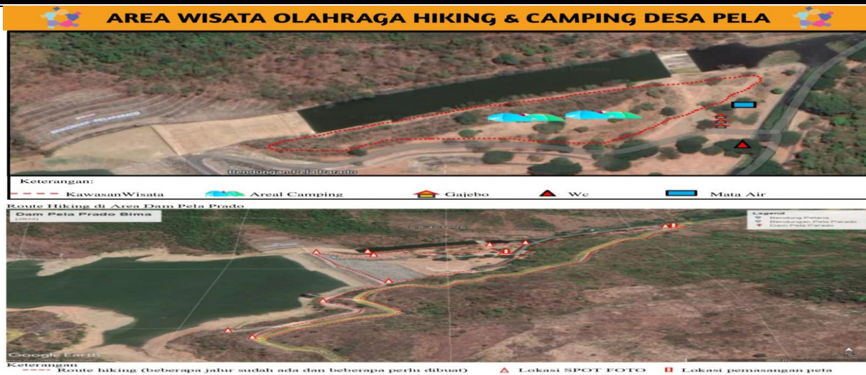
Gambar 4. Area Wisata Olahraga Hiking & Camping Desa Pela

Potensi pengembangan wisata olahraga di kawasan DAM Pela parado sangat memungkinkan sehingga pada dampak pada peningkatan ekonomi masyarakat sekitar. DAM Pela merupakan daerah dibawah pengelolaan BWS yang belum dikelola dengan baik sehingga tim pengabdian melakukan berbagai kegiatan yang dapat memberikan pemahaman pemerintah, BWS dan masyarakat setempat melalui berbagai kegiatan yaitu Focus Group Discussion (FGD) , Workshop dan Diseminasi proses pengelolaan wisata olahraga di Desa Pela. Kegiatan pengabdian ini dilakukan beberapa bulan sehingga tim Pengabdian melakukan berbagai upaya untuk mengembangkan lokasi DAM Pela Parado menjadi lokasi wisata yang dapat diminati masyarakat diberbagai wilayah.