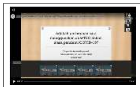
Gambar 3.4 Adakah Perbedaan Cara Menggunakan Obat TBC di masa Pandemi Covid-19?