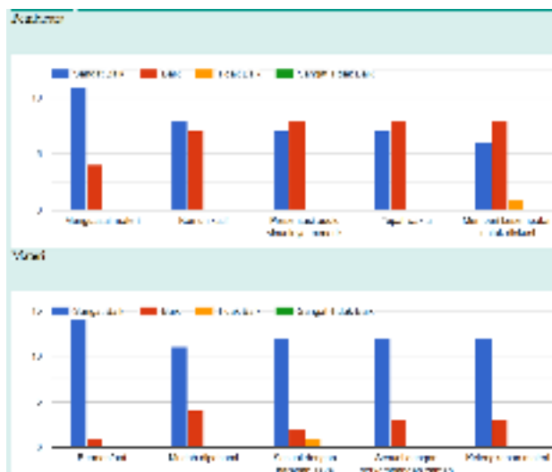
Gambar 4.8 Penilaian responden terhadap narasumber dan materi

Di akhir acara, responden juga dimintakan untuk memberikan penilaian terhadap narasumber dan materi edukasi, seperti yang terlihat pada Gambar 4.8 . Aspek yang dinilai untuk narasumber adalah penguasaan materi, komunikasi, audio visual, ketepatan waktu, kesempatan diskusi, semuanya mendapatkan poin baik dan sangat baik. Hasil penilaian untuk aspek materi yang diberikan memperoleh kriteria sangat baik untuk semua elemen yang meliputi; manfaat, mudah dipahami, sesuai dengan harapan, sesuai dengan perkembangan zaman dan kelengkapan materi.