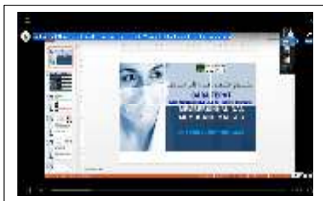
Gambar 3.3 Cara Tepat Menggunakan, Melepas, Membersihkan dan Membuang Masker