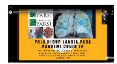
Gambar 3.2 Pola Hidup Lansia pada Pandemi Covid-19