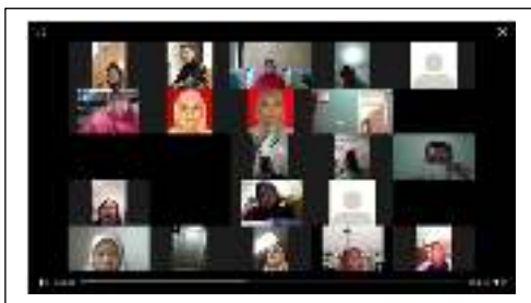
Gambar 4.1 Foto Peserta kegiatan PkM daring

Keseluruhan peserta edukasi secara virtual terlihat pada Peserta yang diberikan kuota pulsa untuk mengikuti kegiatan secara daring berjumlah 24 orang, dapat terlihat pada gambar berikut.