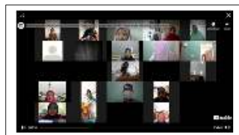
Gambar 4.2 Foto Peserta kegiatan PkM daring