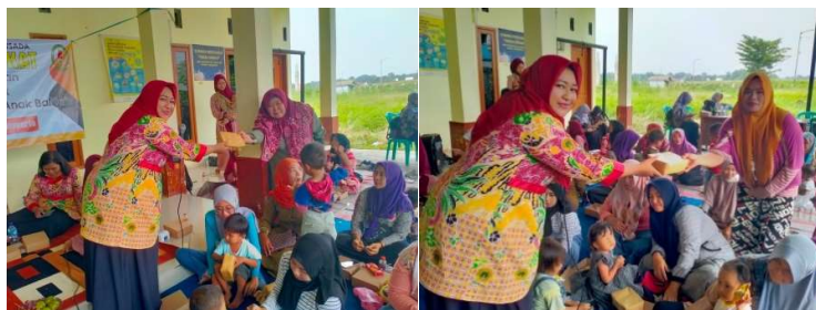
Gambar : Tanya Jawab dan Bagi Penanya Diberikan Hadiah

Kegiatan pengabdian masyarakat ini merupakan salah satu kegiatan MBKM (Merdeka Belajar Kampus Merdeka)[6]. Pembicara juga memberikan pengetahuan mengenai beberapa penyebab stunting, diantaranya kurangnya asupan gizi selama hamil, kebutuhan gizi anak tidak tercukupi, pola asuh dalam pemberian makan dan pemberian asi eksklusif yang tidak maksimal, terbatasnya akses pelayanan kesehatan, dan rendahnya akses sanitasi dan air bersih. Terkait asupan gizi selama hamil, ibu hamil perlu memastikan asupan vitaminnya seimbang. Vitamin yang diperlukan selama kehamilan diantaranya asam folat untuk mencegah cacat tabung saraf, zat besi untuk membantu membawa oksigen dalam darah, kalsium untuk mencegah berkurangnya kepadatan tulang, dan yodium untuk mendukung fungsi tiroid selama masa kehamilan..